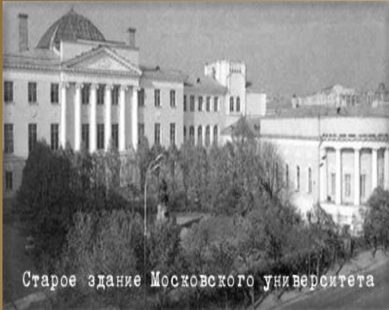
Старое здание Московского университета

Творческие интересы В.И. Вернадского были очень широки. Он был не только геологом, но и занимался биологией, изучением почв, природных вод, метеоритов, проблем радиоактивности. Общей характерной чертой исследований ученого является фундаментальность.