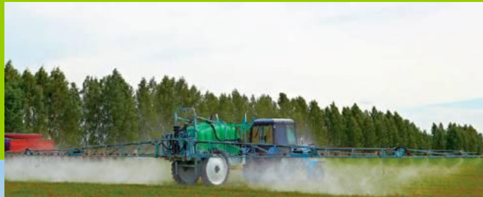
Применение удобрений и ядохимикатов