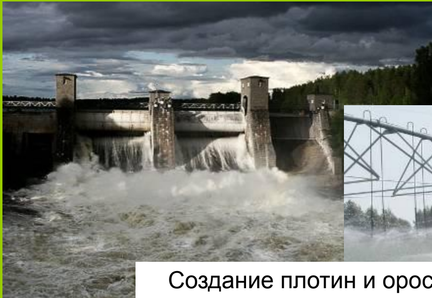
Создание плотин и оросительных систем