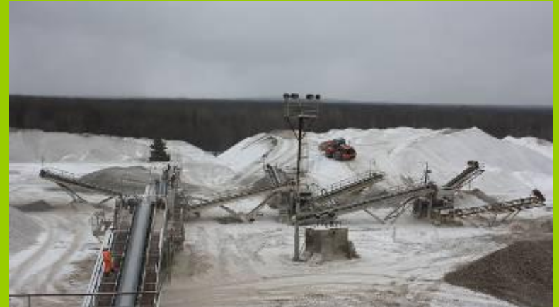
Разработка полезных ископаемых