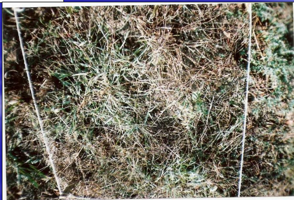
Приложение 7. Растительный покров. Участок №1. Август 2008г.