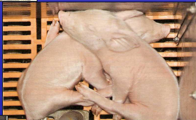
Приложение 3. Микроклимат налажен: пол с подогревом.