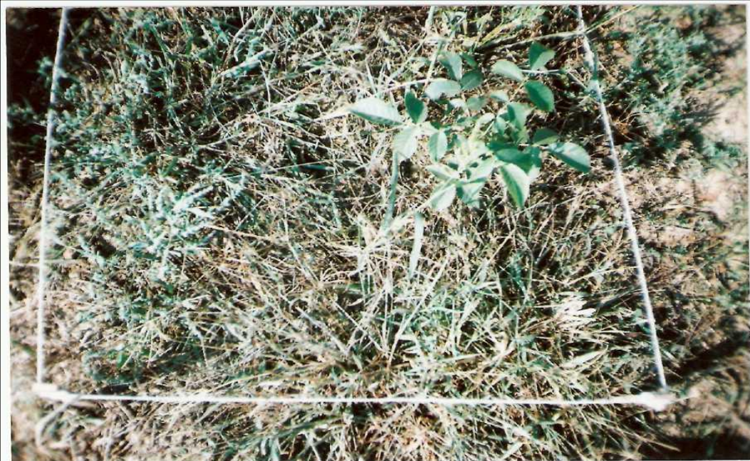
Приложение 6. Растительный покров. Участок №1. Август 2007г.