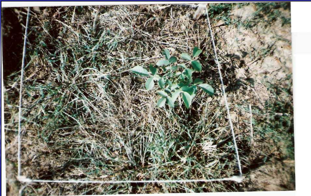
Приложение 15. Растительный покров. Участок №1. Август 2009 г.