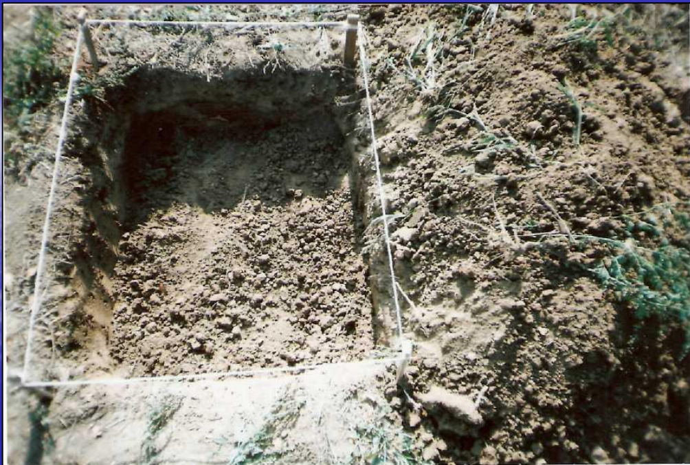
Приложение 8. Почвенная фауна. Участок №2. Август 2007 г.