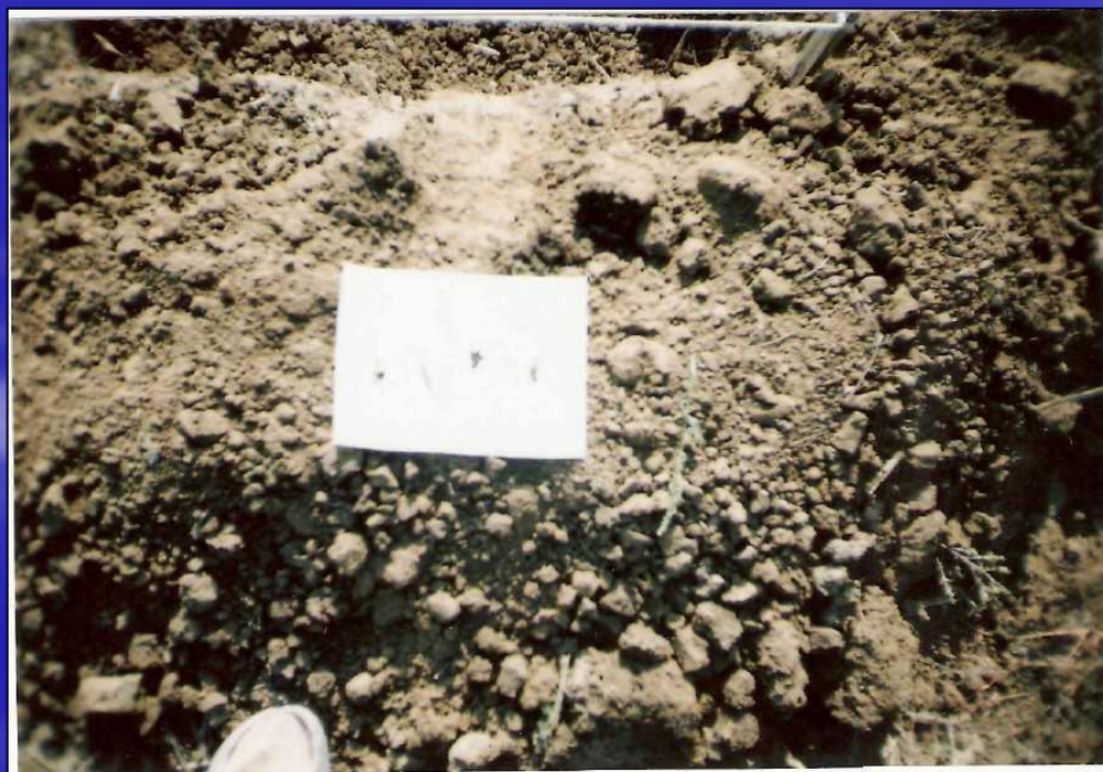
Приложение 11. Почвенная фауна. Участок №2. Август 2008 г.