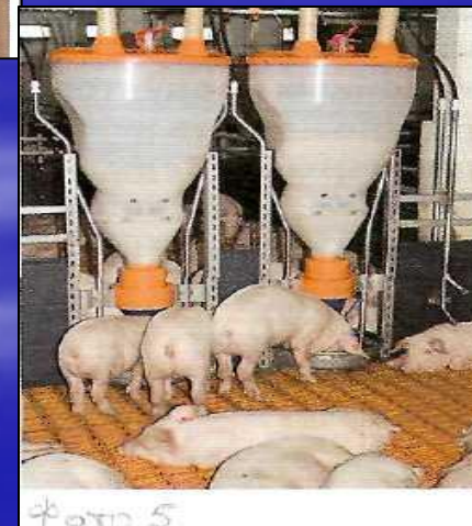
Приложение 5. Корпус «дорастивания»: автоматические кормушки и поилки с медикаторами.