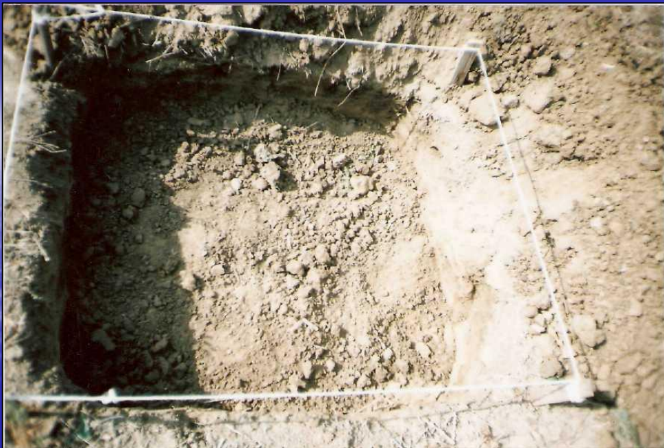
Приложение 10. Почвенная фауна. Участок №2. Август 2008 г.