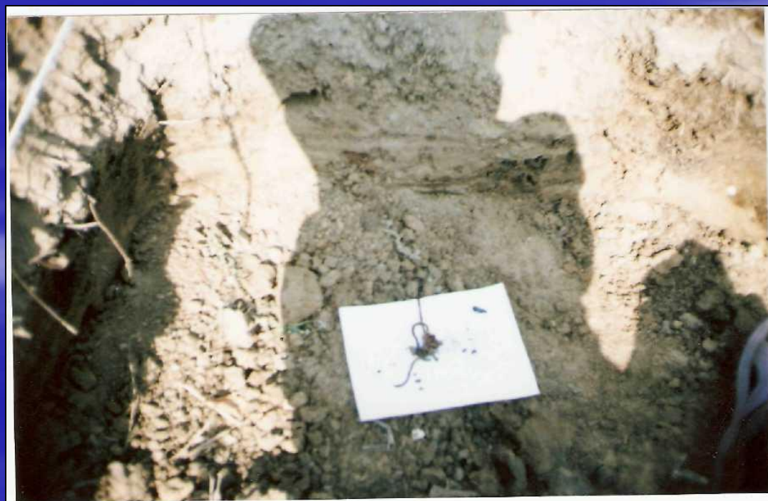
Приложение 16. Почвенная фауна. Участок № 2. Август 2009г.