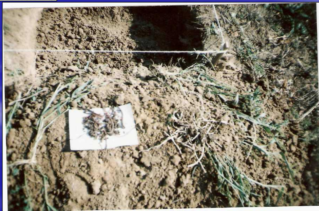
Приложение 9. Почвенная фауна. Участок №2. Август 2007 г.