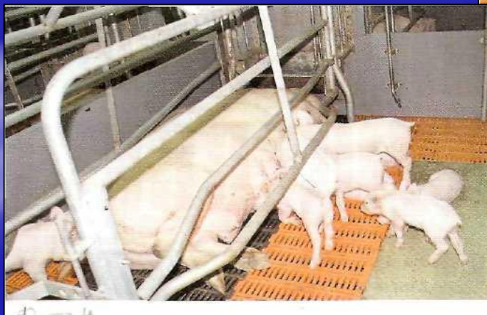
Приложение 4. Корпус – «маточник».