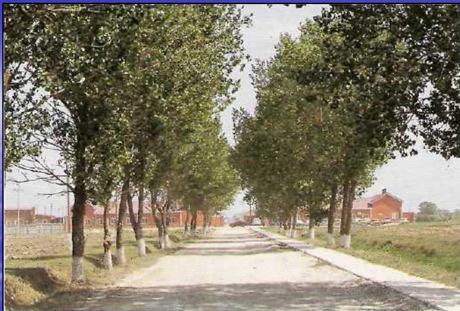
Приложение 1. ООО «Нива Приазовья» - один из крупнейших свиноводческих комплексов Краснодарского края.