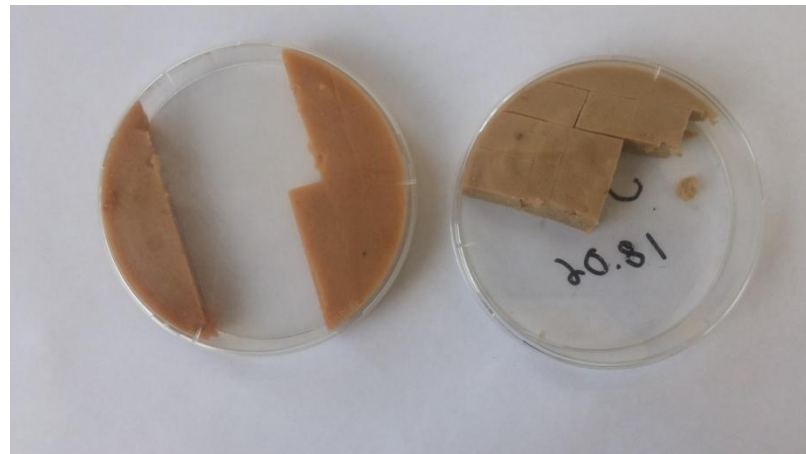
Рис.4 ИПС с дрожжевым экстрактом (слева) и ИПС с кукурузной мукой (справа)