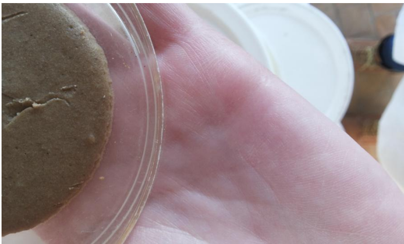
Рис.5 Край ИПС с фасолью, объединенный гусеницами НШ