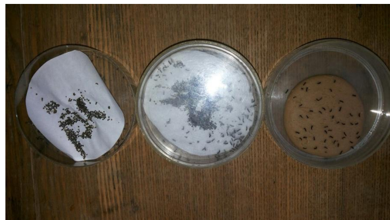
Рис.6 Этапы лабораторного культивирования гусениц НШ