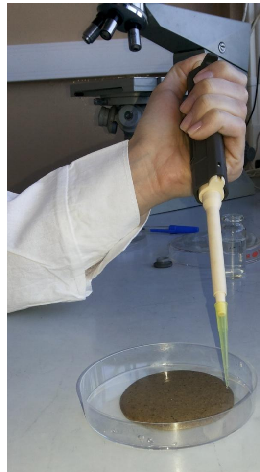
Рис.7 Нанесение вирусной суспензии