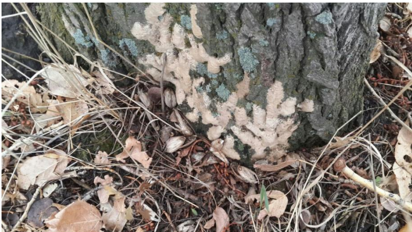
Рис.3 Грена НШ