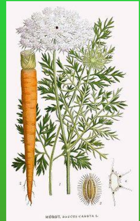
Вид: Морковь дикая

Морковь — двулетнее растение (редко одно- или многолетнее), в первый год жизни образует розетку листьев и корнеплод[1], во второй год жизни — семенной куст и семена.