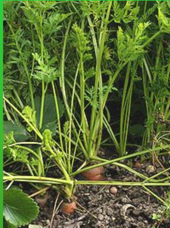
Вид: Морковь посевная

Царство: Растения Отдел: Покрытосеменные Класс: Двудольные Порядок: Зонтикоцветные Семейство: Зонтичные Род: Морковь Вид: Морковь посевная