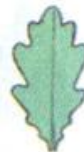
с волнистым краем