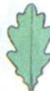
с волнистым краем