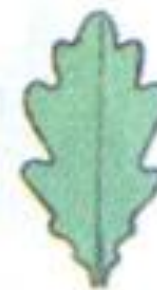
с волнистым краем