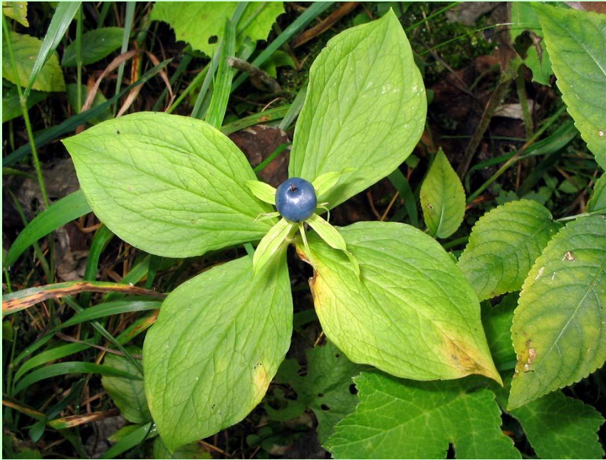
Вороний глаз – сетчатое жилкование, но класс - однодольные