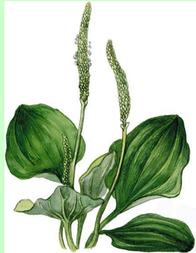
Подорожник – дуговое жилкование, но класс - двудольные