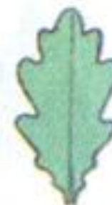
с волнистым краем