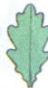
с волнистым краем