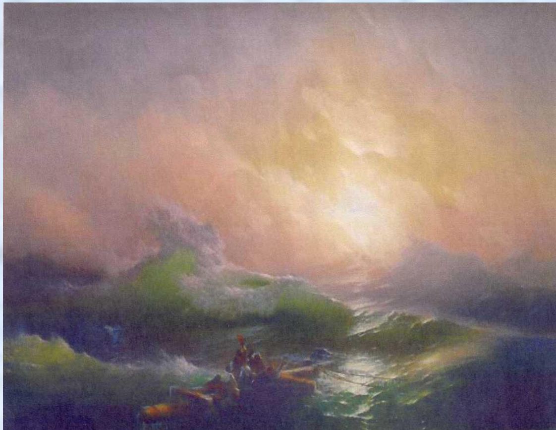
И.К. Айвазовский «Девятый вал»

«Море – это моя жизнь» - сказал известный русский художник-моренист И.К. Айвазовский.