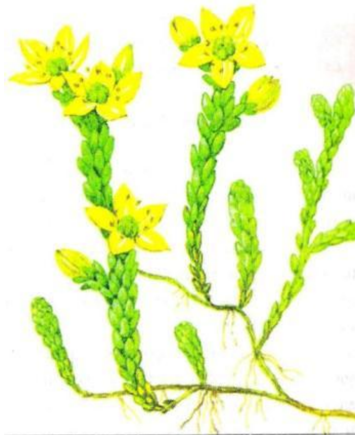
Рис. 24. Очиток едкий – листовой суккулент

В Средней полосе России на сухих, сильно прогреваемых склонах растет небольшое растение очиток едкий (рис. 24), а в сосняках на сухой песчаной почве — молодило побегоносное . Эти листовые суккуленты, чтобы высушить для гербария, предварительно ошпаривают кипятком, иначе живые листья будут прочно удерживать воду и не засохнут. У этих растений при сушке могут раскрыться и зацвести бутоны.