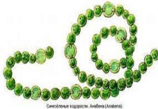
Скелетные водоросли. Анабена (Anabena)