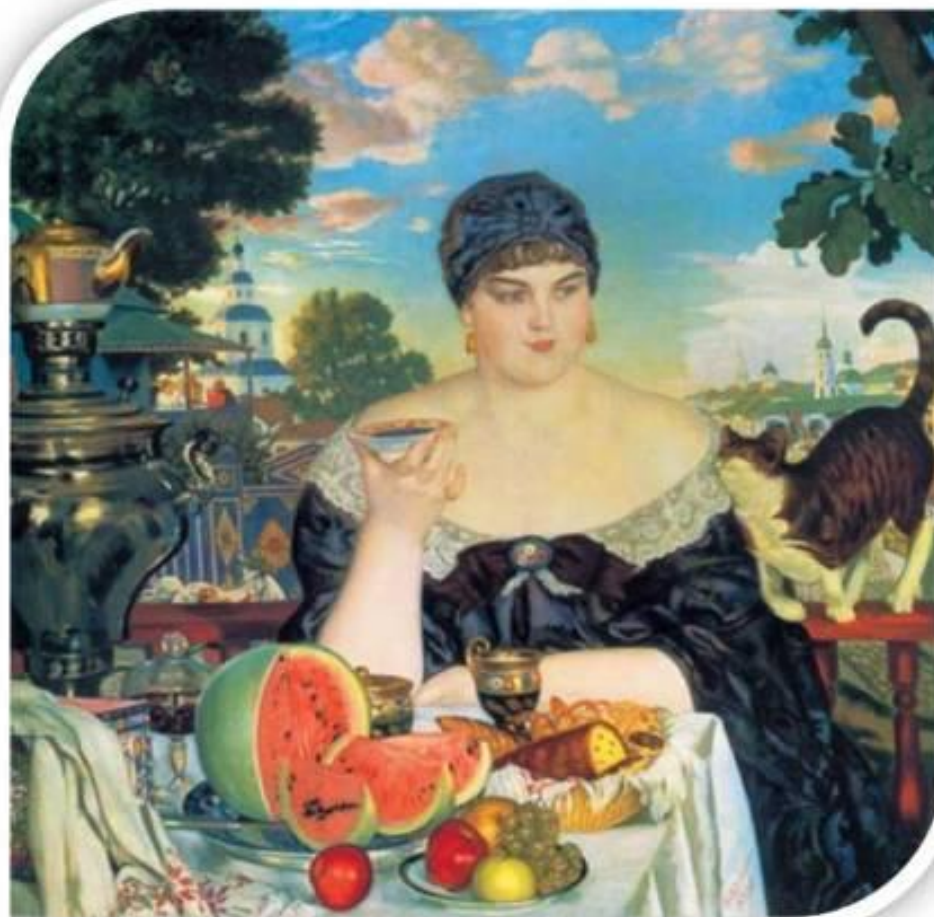
Кустодиев Б.М. «Купчиха за чаем»