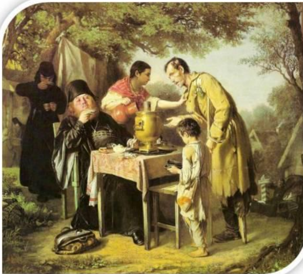
В.Г. Перов. «Чаепитие в Мытищах»