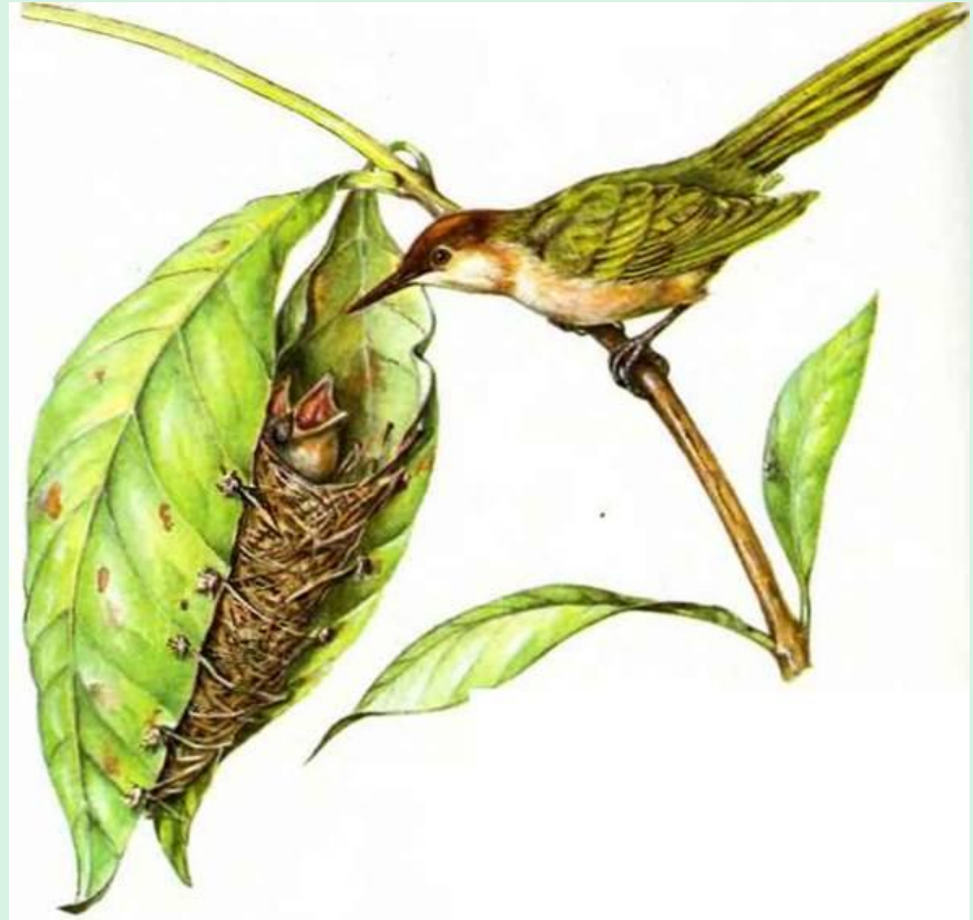
Птица-портниха у гнезда. Пакетик из листьев она сшивает специально подготовленными хлопковыми волокнами. Узелки не дают нитям развязаться.