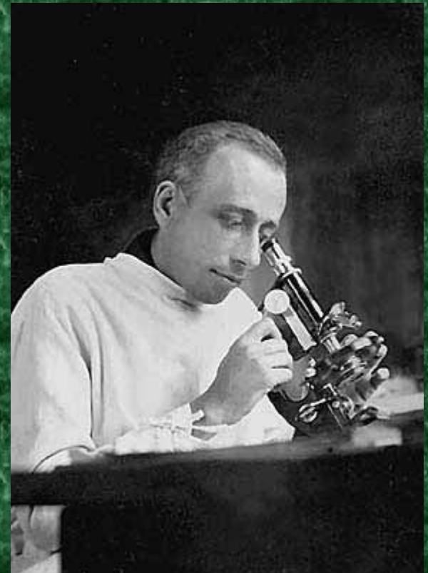
Георгий Фёдорович Гаузе (1910–1986)

К какому типу биотических взаимодействий относится этот принцип ?