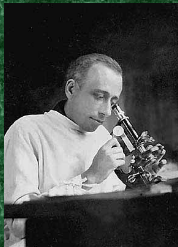
Георгий Францевич Гаузе (1910–1986)

К какому типу биотических взаимодействий относится этот принцип ?