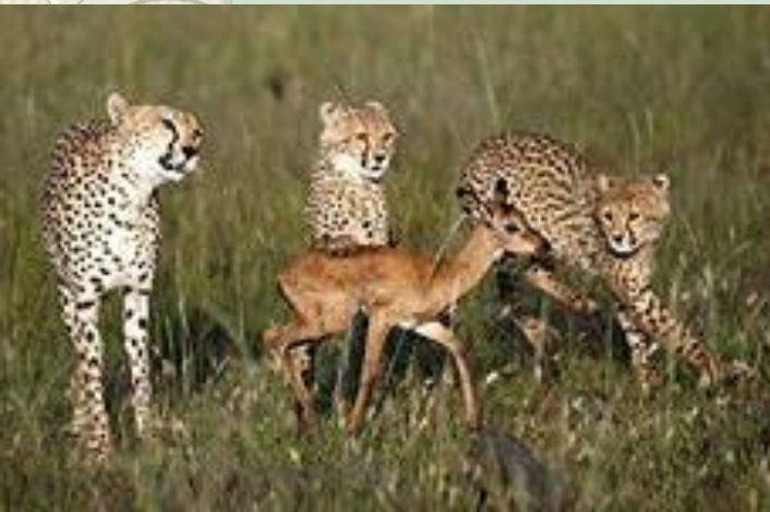
Учатся охотиться детёныши леопардов