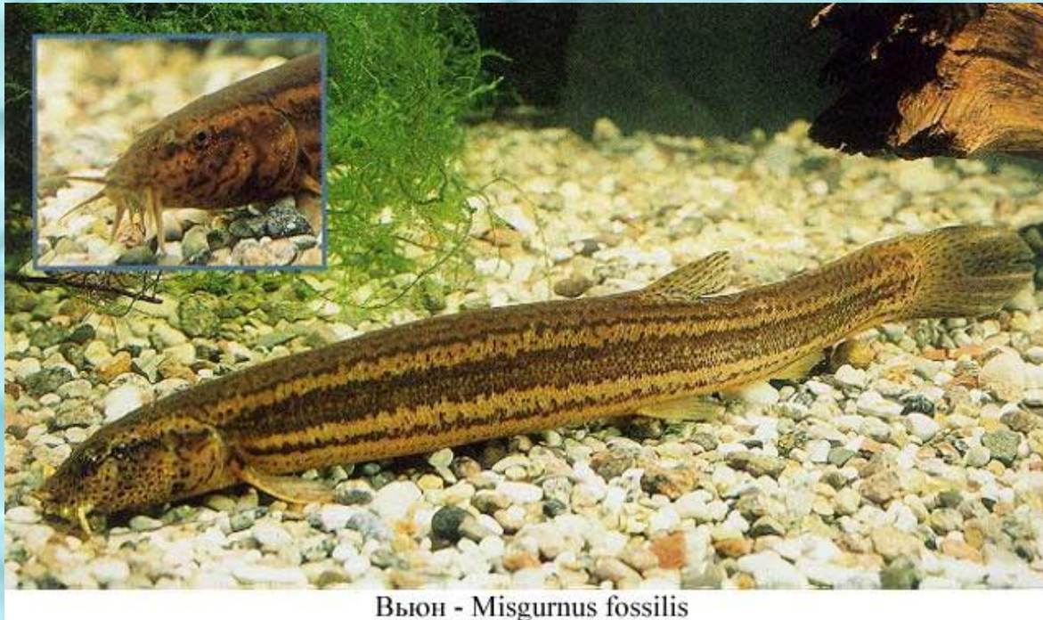
Вьюн - Misgurnus fossilis