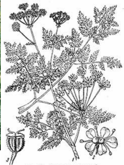
Рис. 223. Болиголов крапчатый. 1 — ветвь, 2 — цветок, 3 — плод.