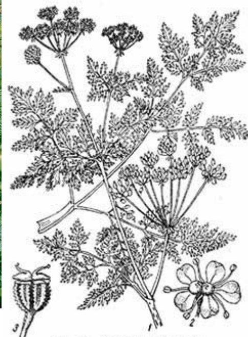
Рис. 223. Болиголов крапчатый. 1 — ветвь, 2 — цветок, 3 — плод.