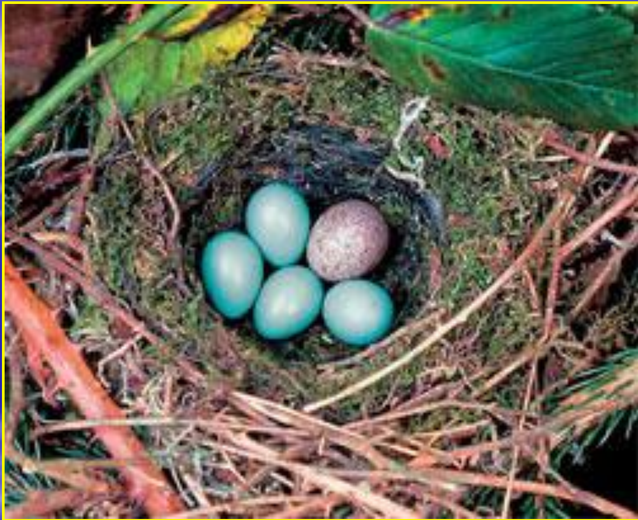
Рис. 12 Яйцо кукушки в чужом гнезде