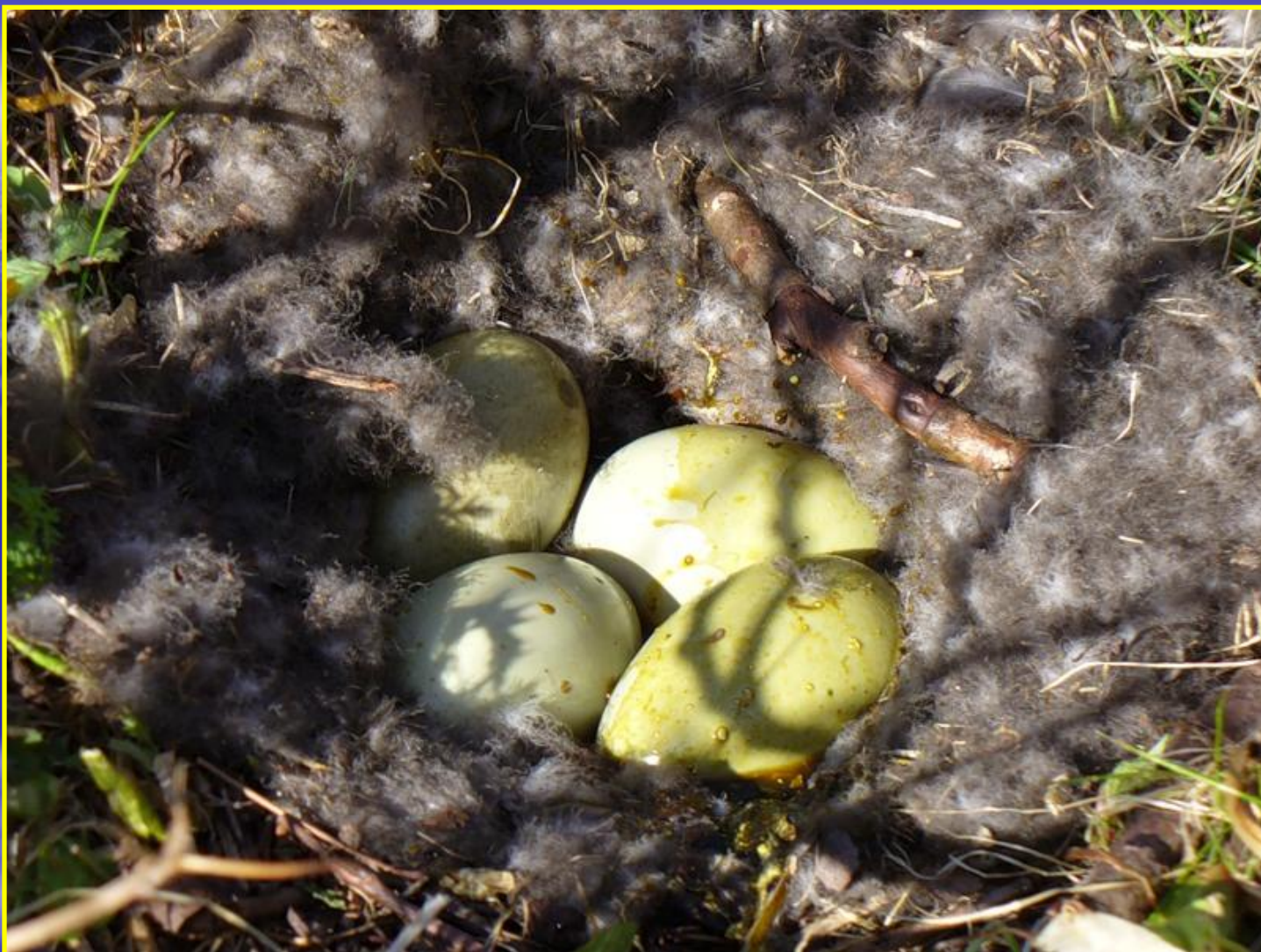
Рис. 11 Гнездо гаги