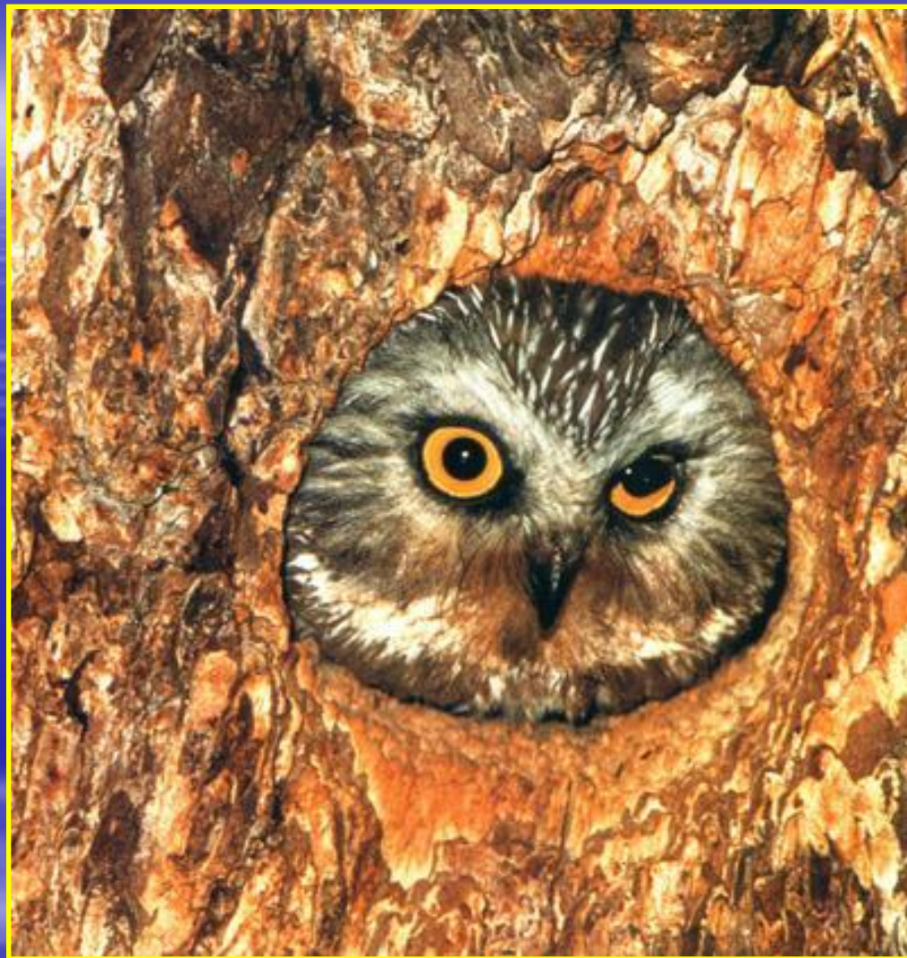
Рис. 9 Сова в дупле