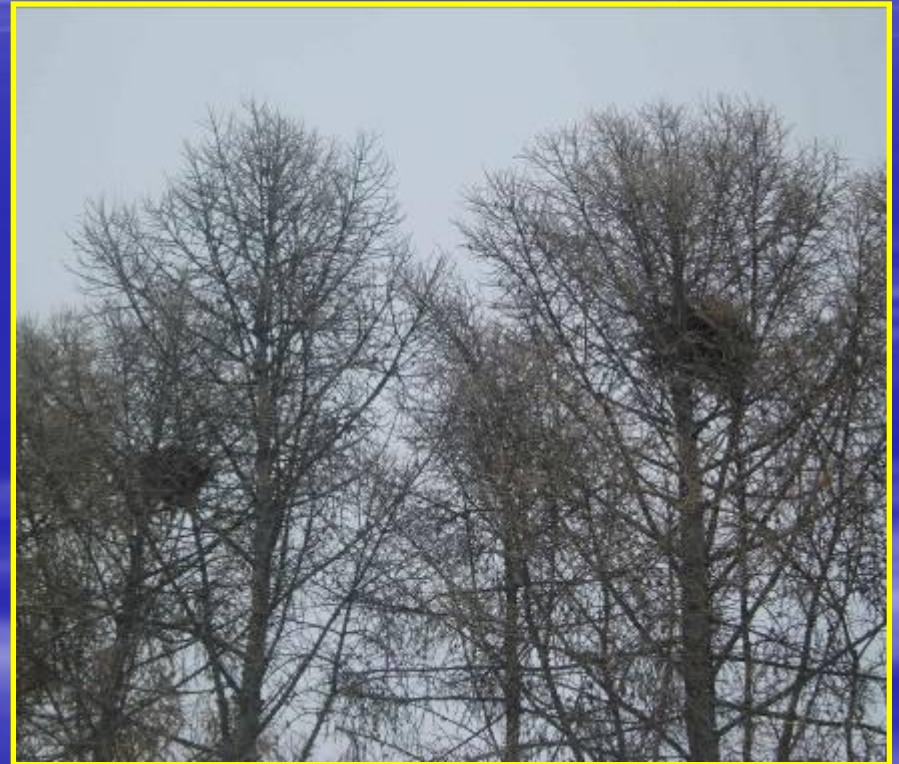
Рис. 13 Гнезда напротив мэрии города Бердска