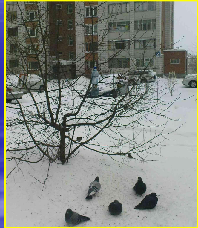
Рис. 22 Кормушка в моем дворе