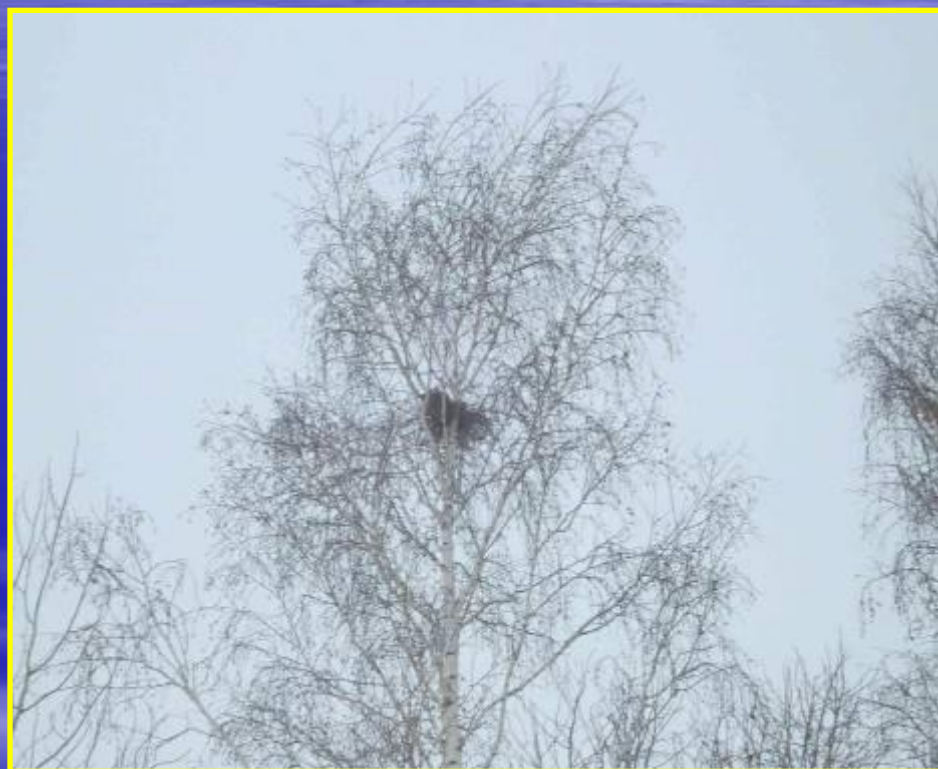
Рис. 16 Гнезда в городском парке