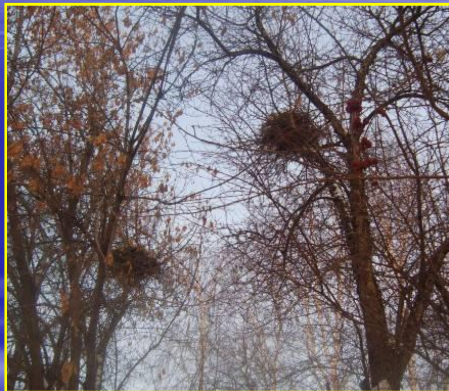
Рис. 15 Гнезда напротив школы № 1