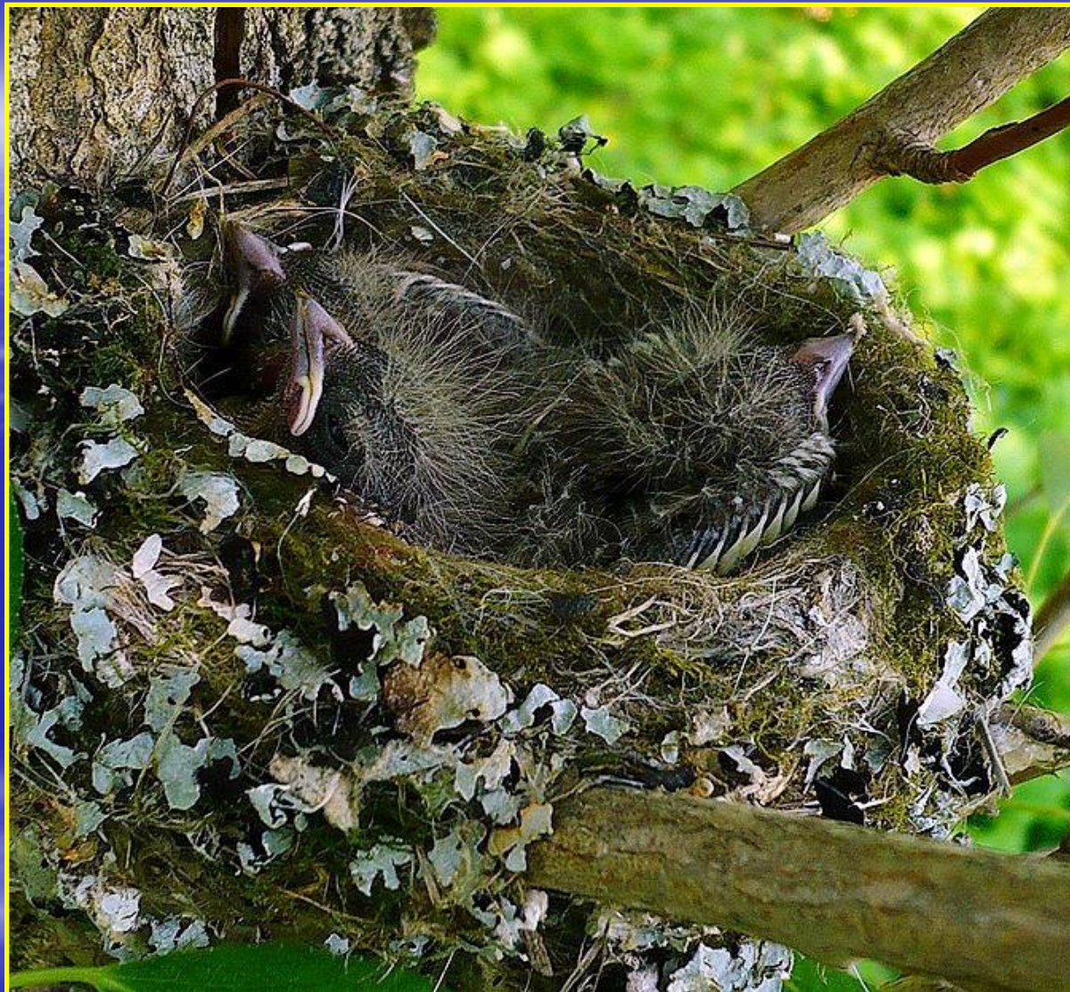
Рис. 4 Гнездо зяблика