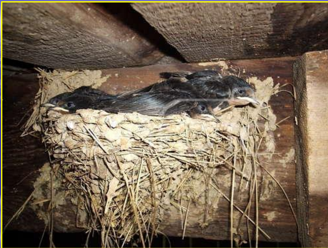
Рис. 6 Гнездо ласточки