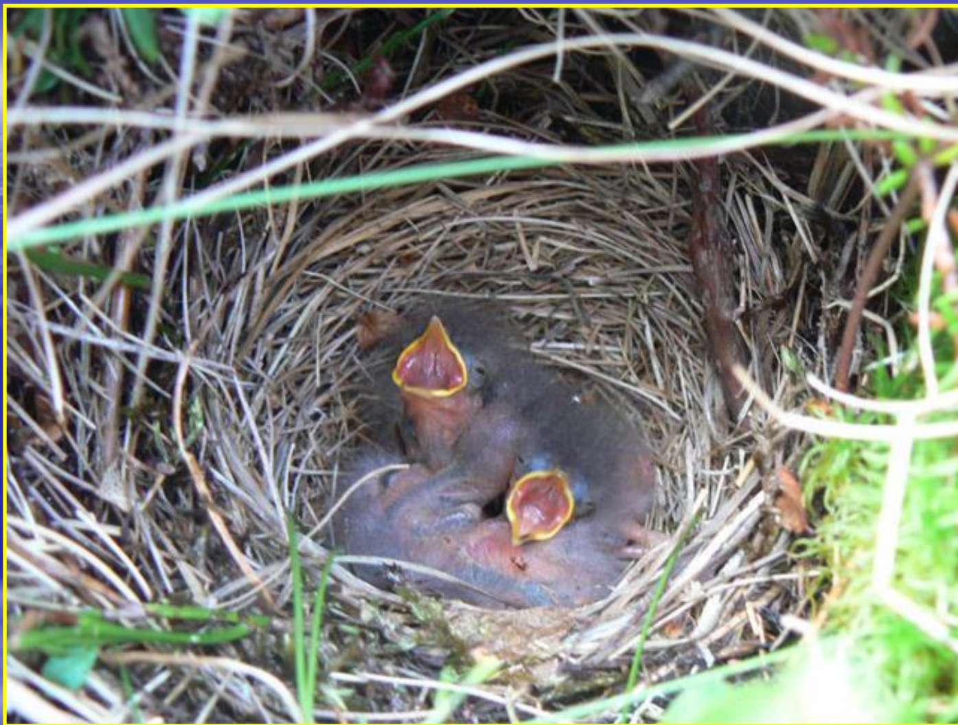
Рис. 3 Гнездо трясогрудки