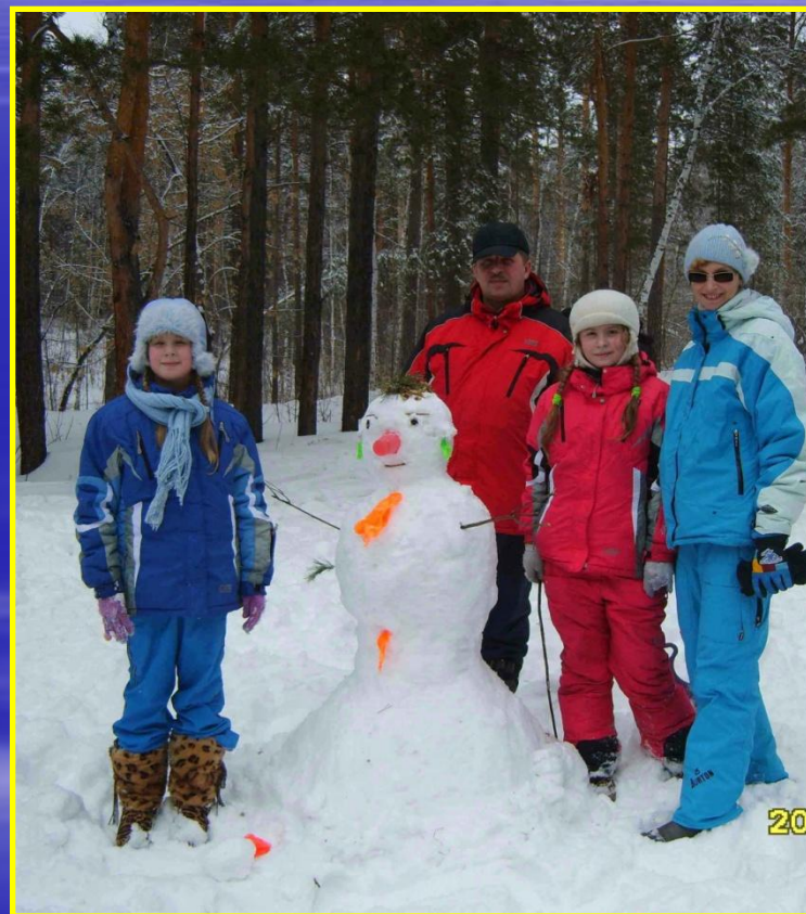
Рис. 20 В лесу с семьей