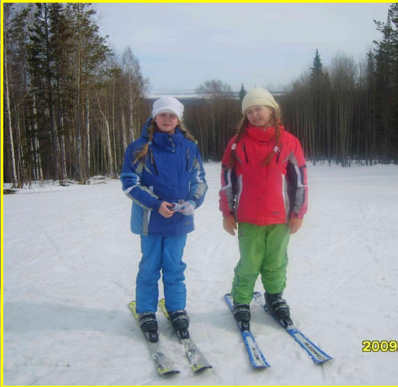
Рис. 21 Катаемся на лыжах и ищем гнезда