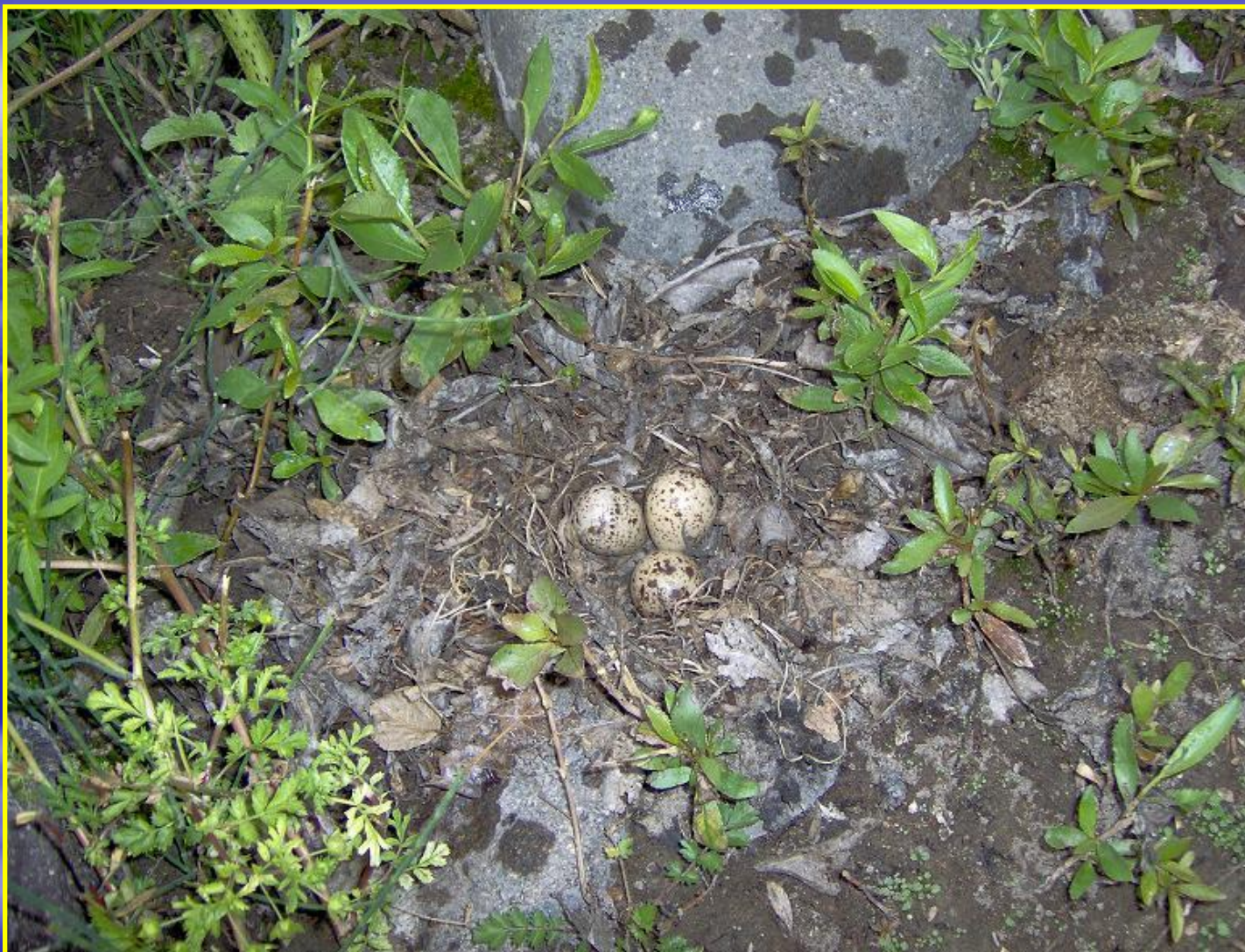
Рис. 8 Гнездо чибиса