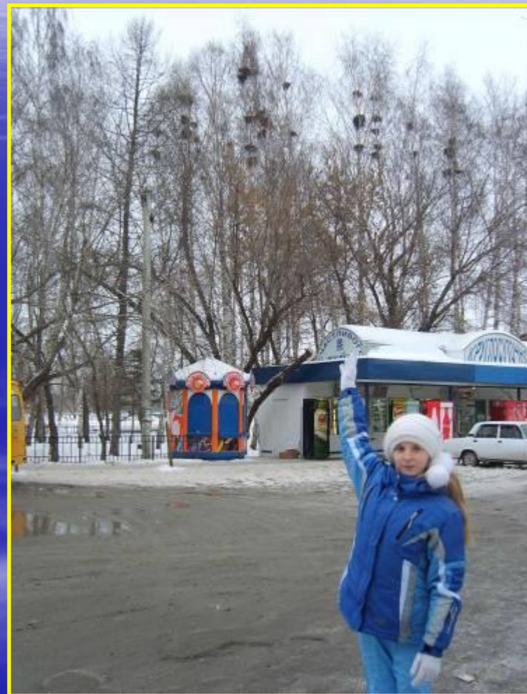
Рис. 17, 18 Гнезда грачей на улице Вокзальной