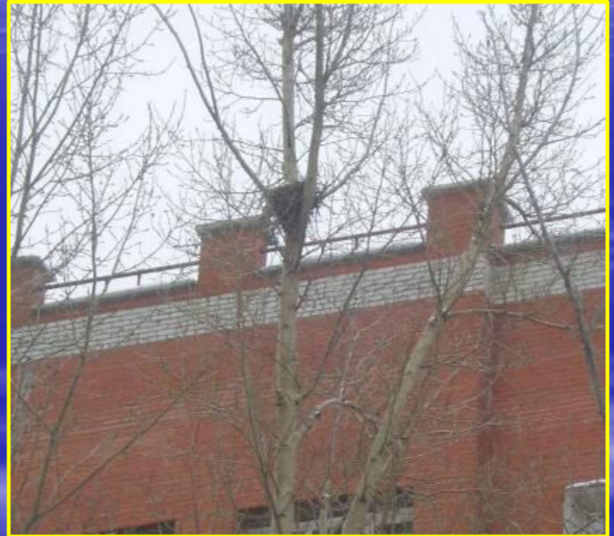
Рис. 14 Гнезда на улице Первомайской