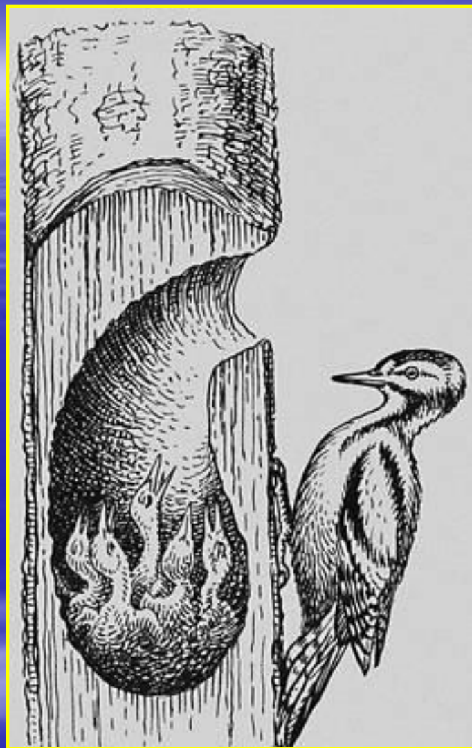
Рис. 7 Гнездо дятла