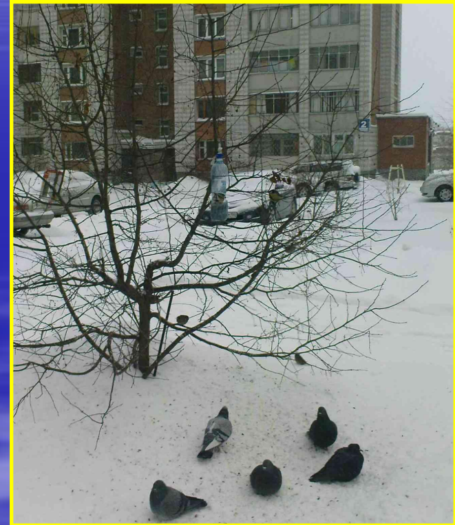
Рис. 22 Кормушка в моем дворе