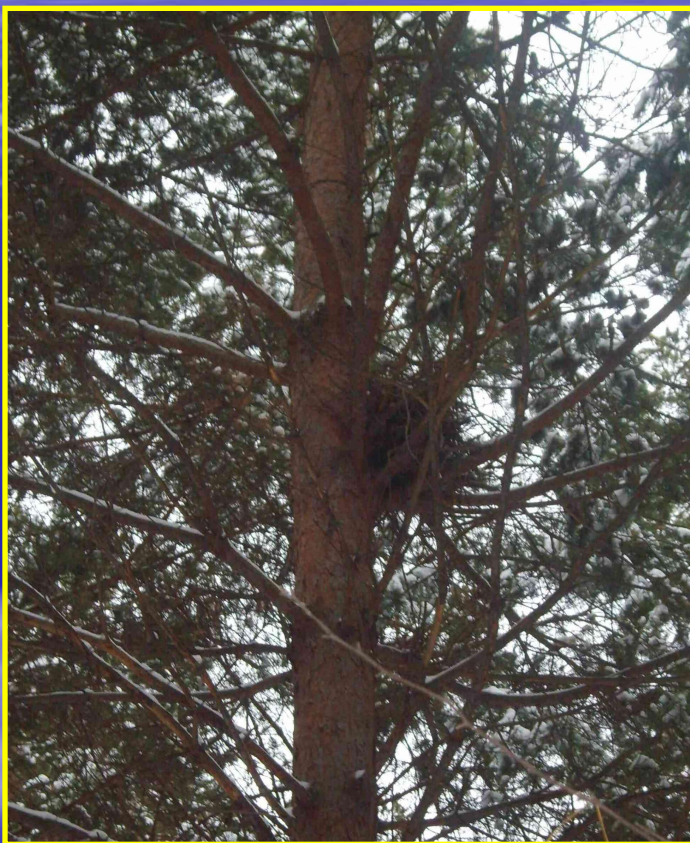
Рис. 19 Гнездо в лесу