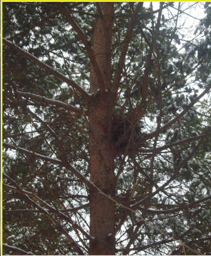
Рис. 19 Гнездо в лесу