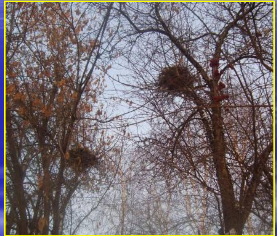
Рис. 15 Гнезда напротив школы № 1