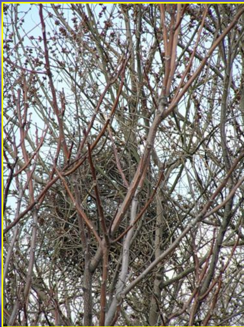
Рис. 2 Гнездо сороки