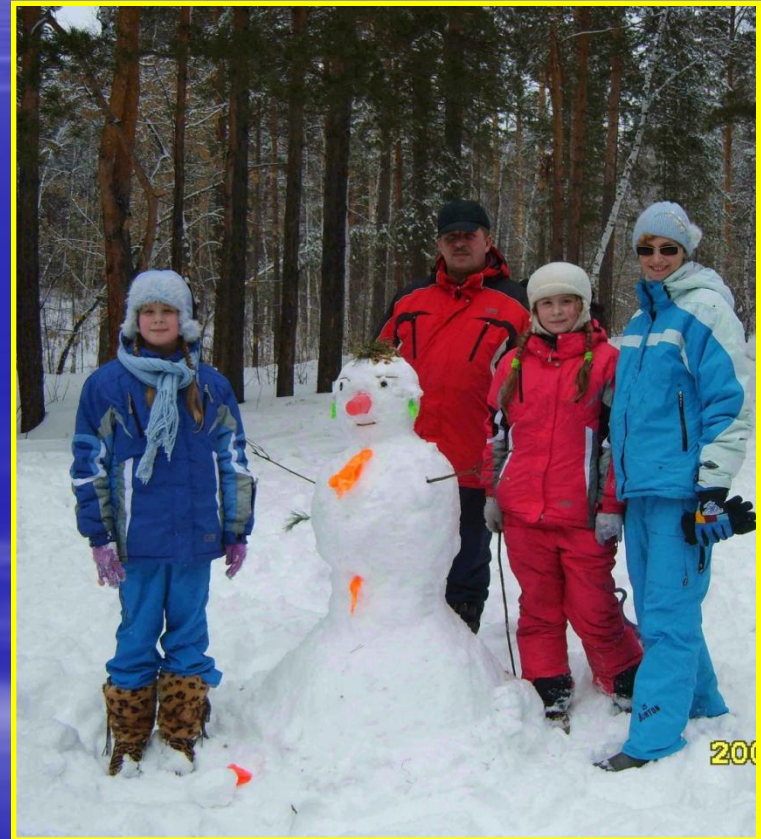
Рис. 20 В лесу с семьей