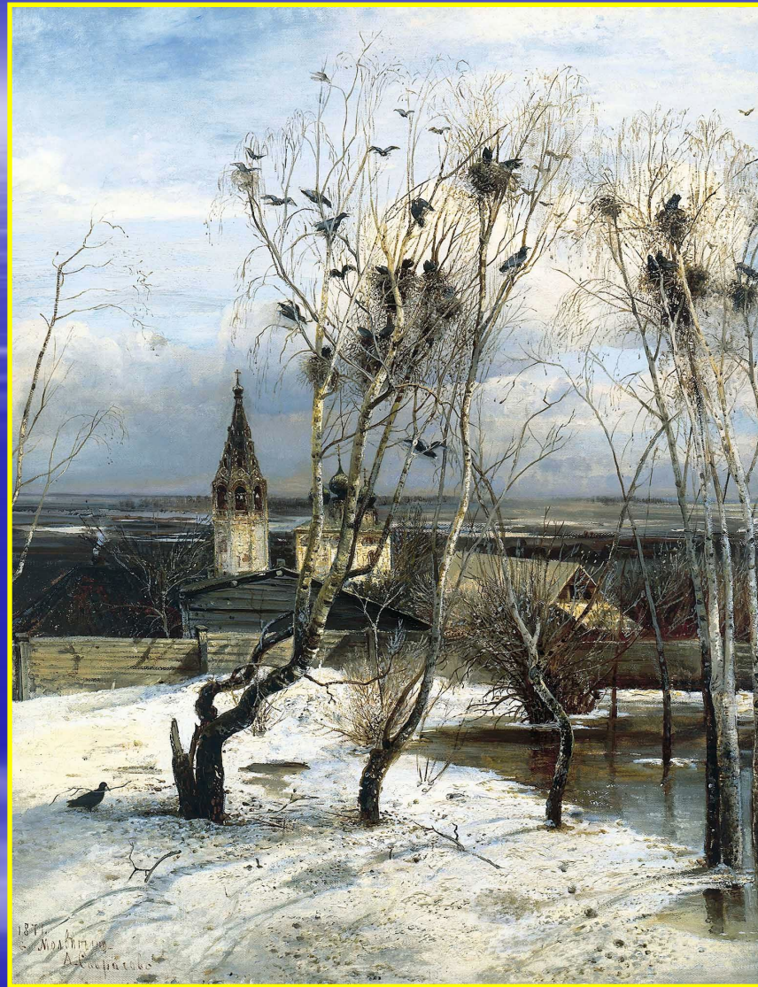
Рис. 1 Грачи прилетели