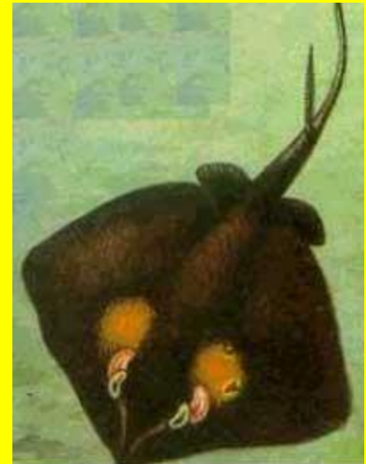
морской кот (Dasyatis pastinaca)