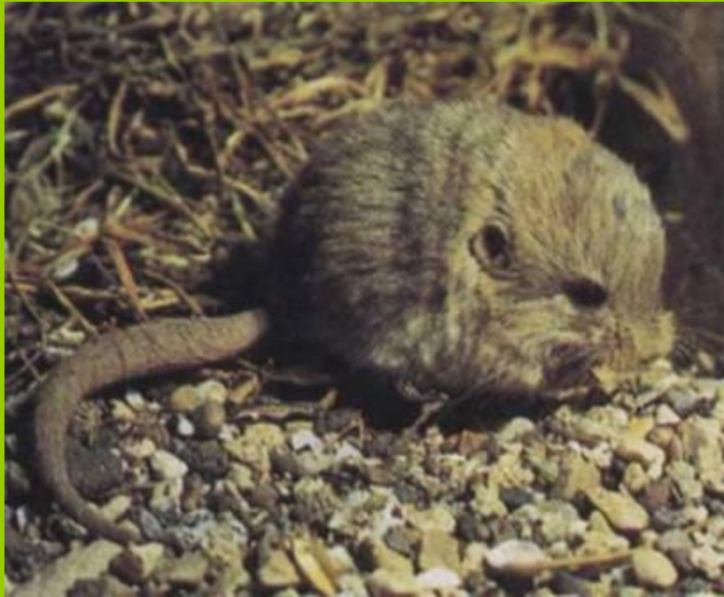
Карликовый жирнохвостый тушканчик