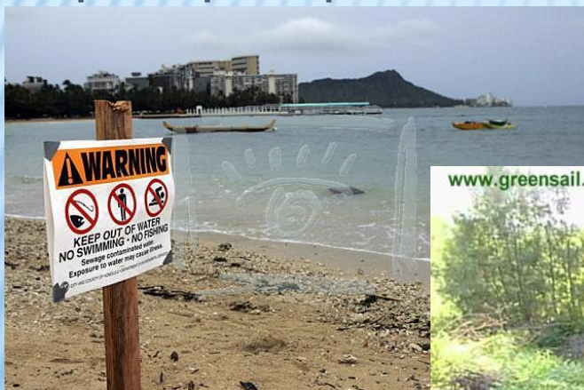
Пропливные дожди в городе Гонолулу (Honolulu) затопили канализационную систему, что способствовало загрязнению воды. На фото: пляж Вайкики (Waikiki Beach), Гавайские острова, 29 марта 2006.