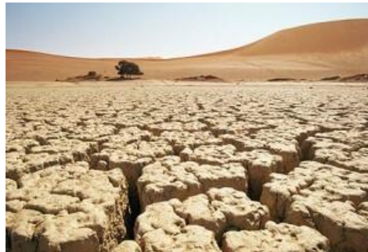
Последствие парникового эффекта