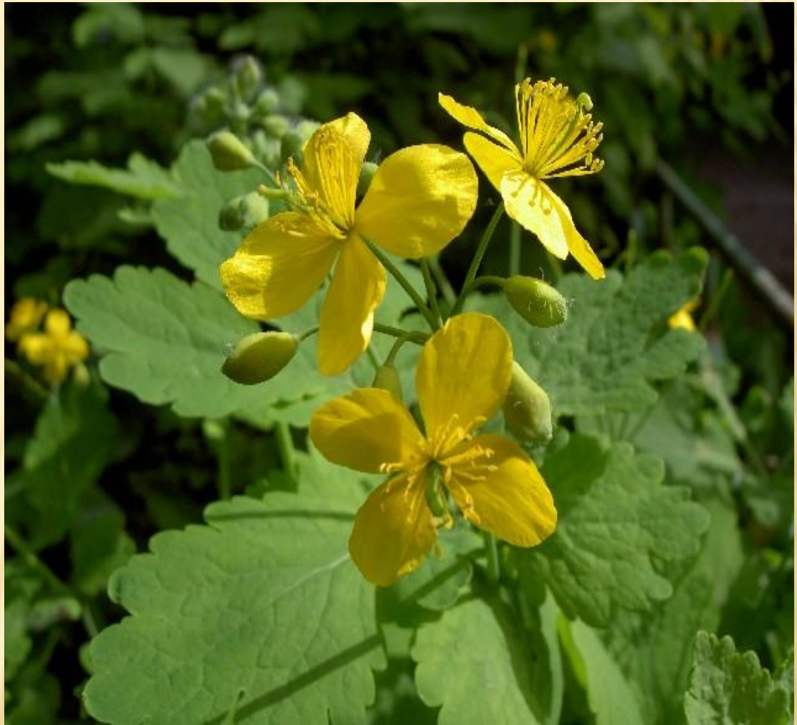
ЧИСТОТЕЛ БОЛЬШОЙ (CHELIDONIUM MAJUS L.)

Чистотел большой ( Chelidonium majus L.) - многолетнее травянистое растение высотой до 1 метра с коротким корневищем.