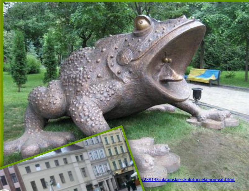
Памятник «Жабе», Киев.