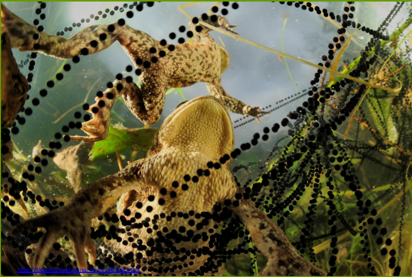
http://www.fishbase.org/species/130000 фотограф Solvin Zankl.