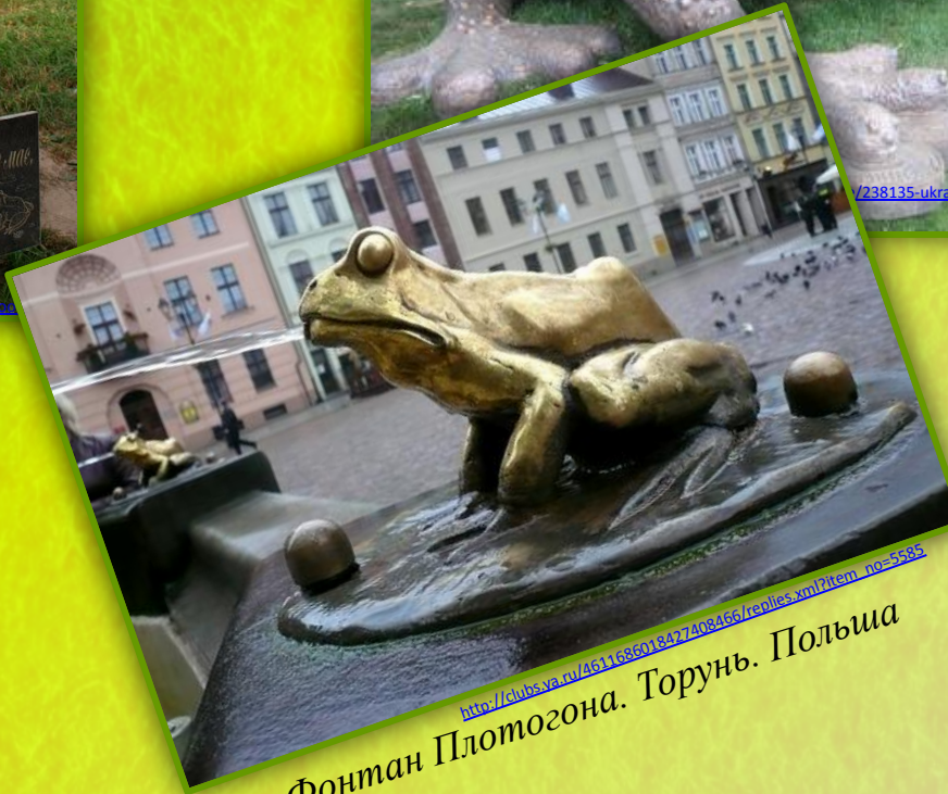
Фонтан Плотогона. Торунь. Польша

Внутри у неё ковш, туда надо бросать монетки. Когда вес в ковше достигнет критической точки, ковш перевернется и одарит деньгами какого-то счастливирика.