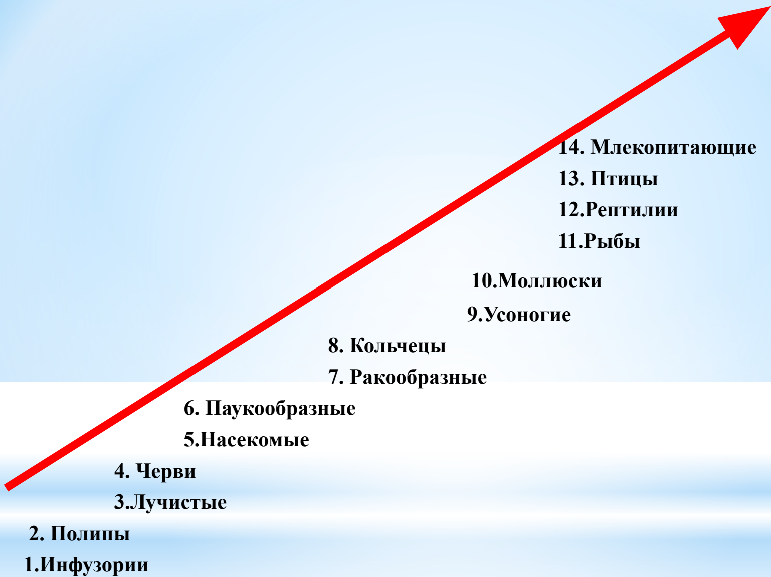
Лестница существ по Ж-Б. Ламарку – система градаций.