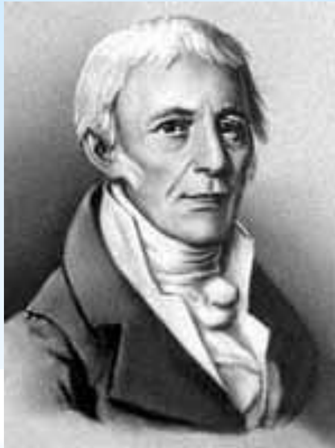
Жан Батист Пьер Антуан Де Моне Шевалье де Ламарк (Lamarck) (01.08.1744, Базантен – 18.12.1829, Париж) французский естествоиспытатель.