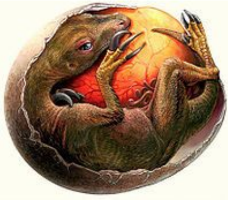
Эмбрион теризинозавра в яйце

Динозавры откладывали яйца, которые имели очень прочную скорлупу и по большому счёту ничем не отличались от яиц птиц и других рептилий. Большинство динозавров строили гнёзда для высиживания потомства. Впервые ископаемые яйца динозавров были найдены в 1859 году во Франции. Они принадлежали гипселозавру. Гнёзда динозавров были обнаружены в 1923 году в пустыне Гоби. Они представляют собой неглубокие ямки в земле или невысокие возвышения округлой формы с углублением посередине.