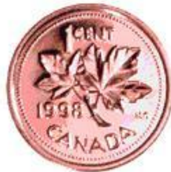
1 Cent Coin "Penny"