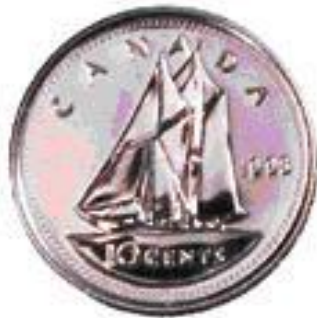
10 Cent Coin "Dime"