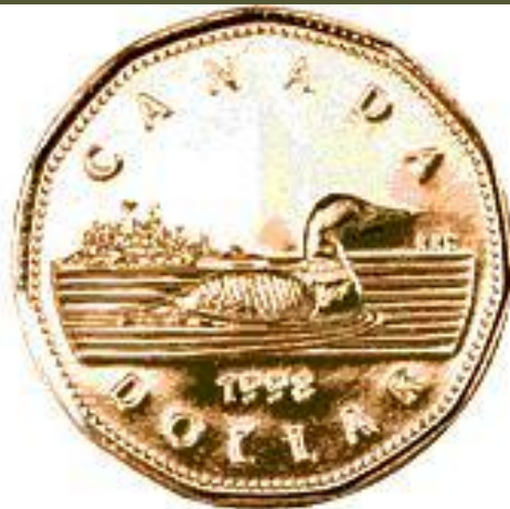
1 Dollar Coin "Loonie"