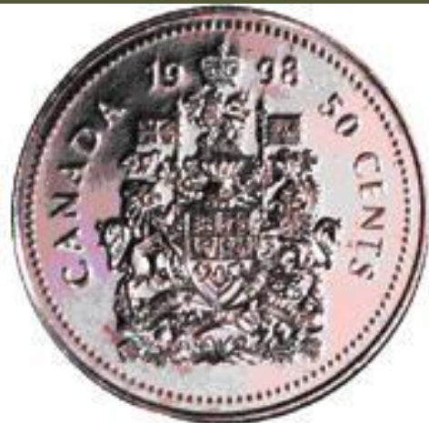
50 Cent Coin