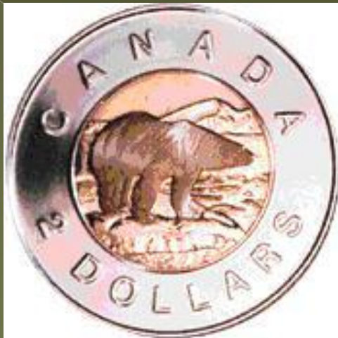
2 Dollar Coin "Toonie"