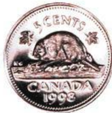
5 Cent Coin "Nickel"