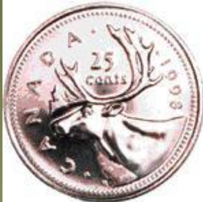
25 Cent Coin "Quarter"