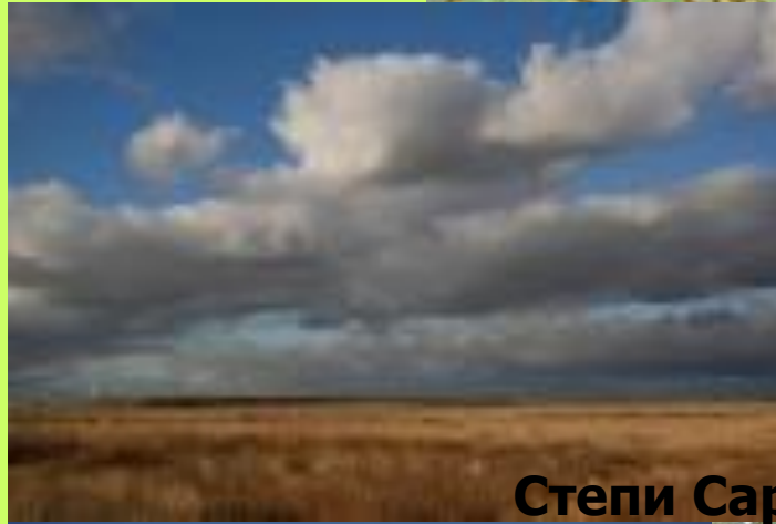
Степи Саратовской области