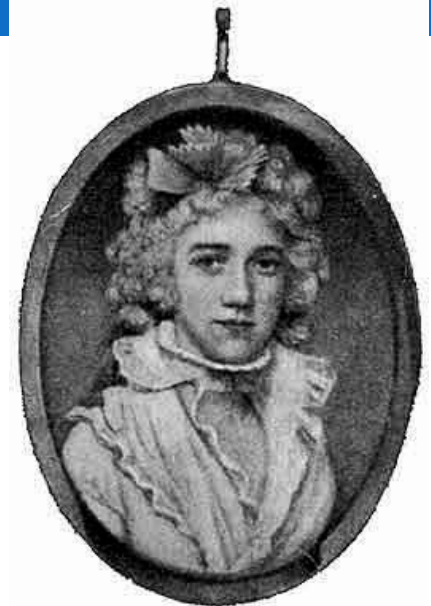
Мать Ч. Дарвина Сусанна Дарвин