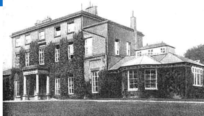
Дом в Шрусбери (Англия), где родился Ч. Дарвин