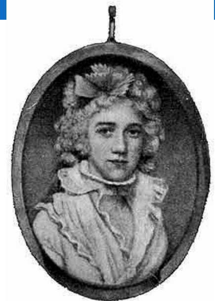
Мать Ч. Дарвина Сусанна Дарвин