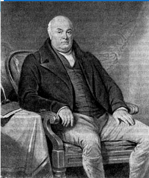
Отец Ч. Дарвина Роберт Уоринг Дарвин