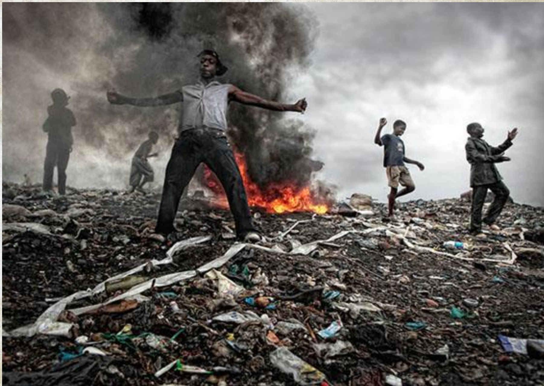
Молодежь проводит все свое свободное время на свалке мусора.