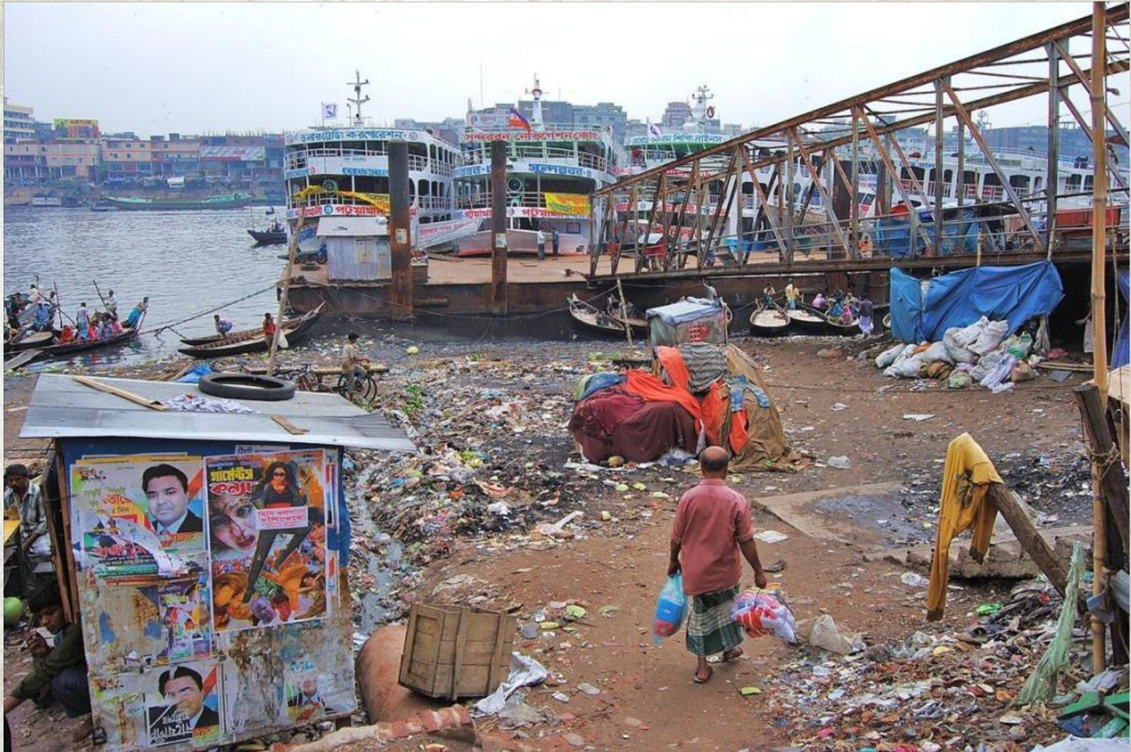
Бангладеш. Столица Дакка.

А в бедных странах пока не нашли решение для этой проблемы. Поэтому людям приходится выживать в этих условиях и приспособляться к ним.