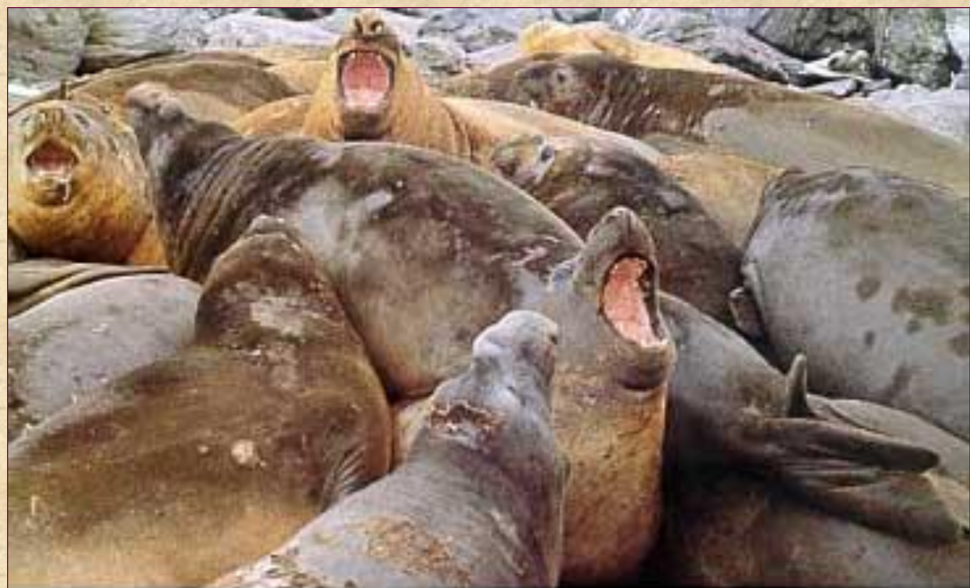
Южный морской слон Mirounga leonina

Ещё один ловец рыбы и головоногих моллюсков.