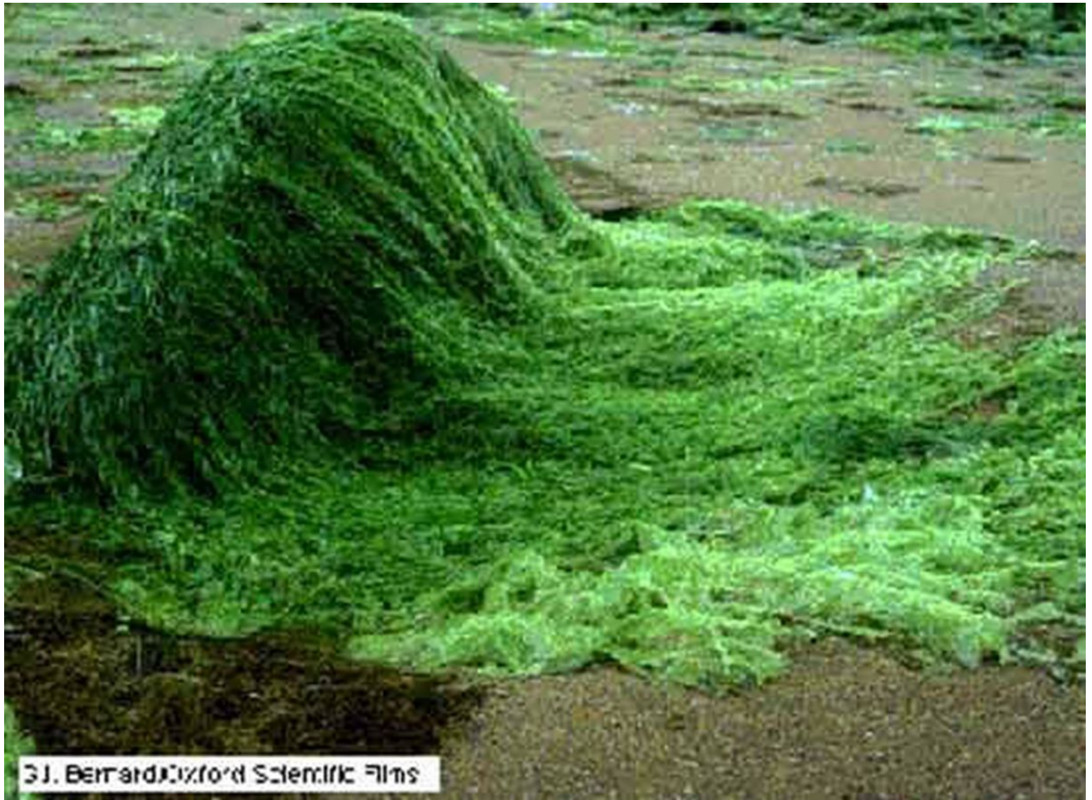
31. Bernard Oxford Scientific Films