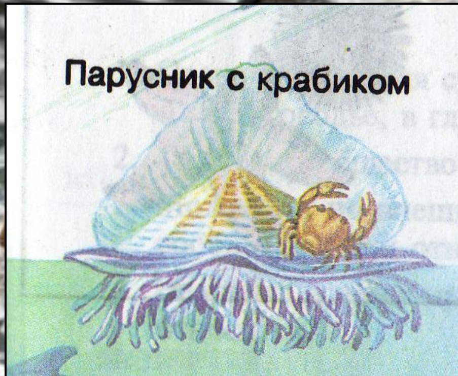
Парусник с крабиком