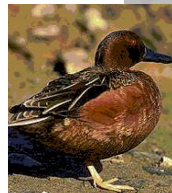
Американская чёрная кряква