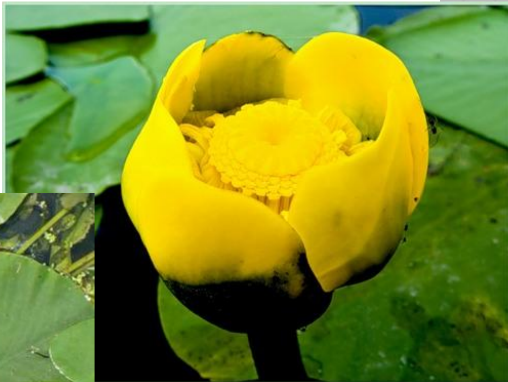
Кубышка (жёлтая кувшинка)