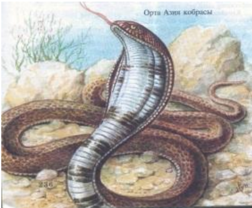
Орта Азия кобрасы