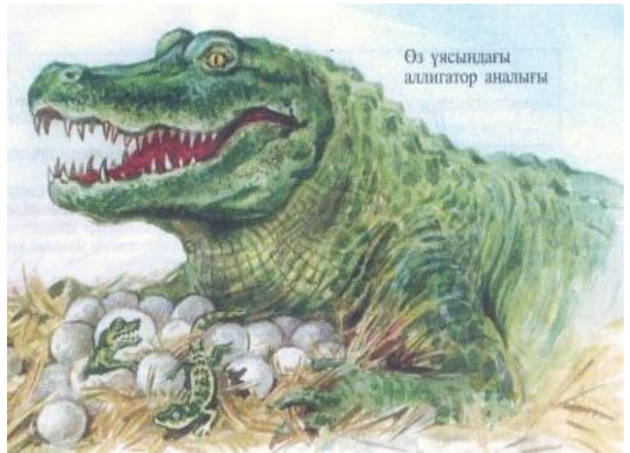
Өз ұясындағы аллигатор аналығы