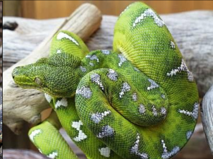
На теле разных змей бывают красивые рисунки – фигурки, пятнышки.