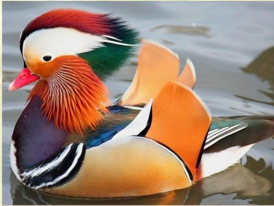
Мандаринка - охраняемая птица