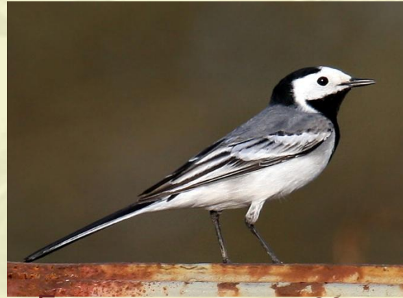
Белая трясогузка-2011 год