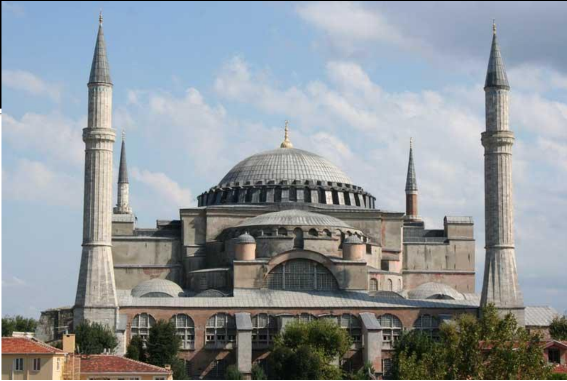
Софийский собор в Константинополе