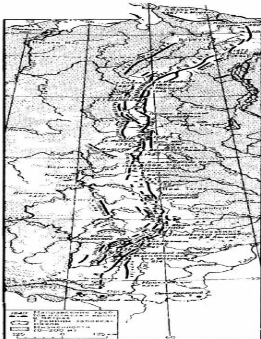
Орографическая схема Урала