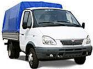
КОНТРОЛЬ СЛУЖБЕНОГО ТРАНСПОРТА