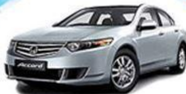
ОХРАНА/КОНТРОЛЬ ЛИЧНОГО ТРАНСПОРТА