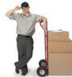
КОНТРОЛЬ ЗА ПЕРСОНАЛОМ