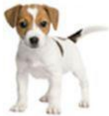
КОНТРОЛЬ ЗА ДОМАШНИМИ ЖИВОТНЫМИ