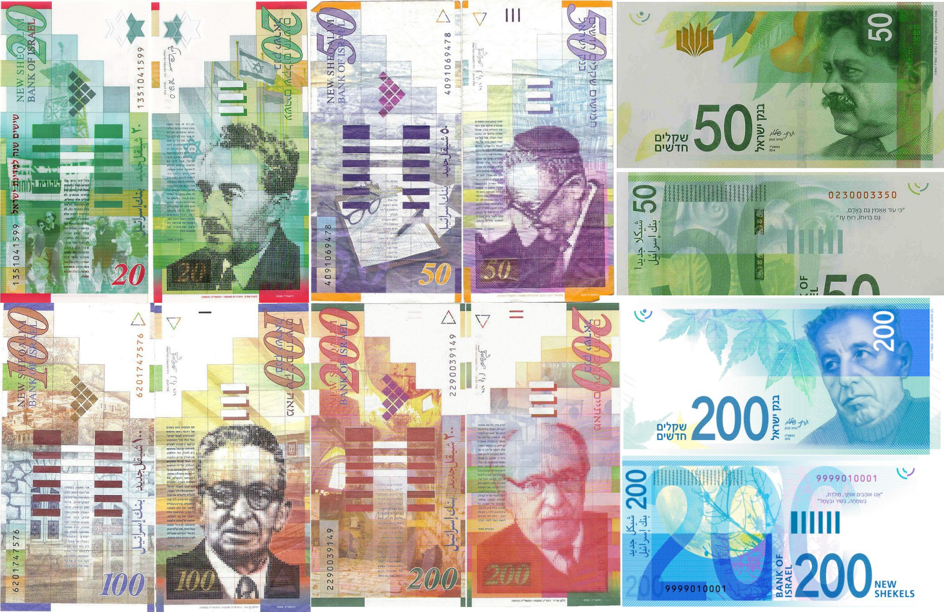
Банкнота в 200 шекеley 2015 года выпуска