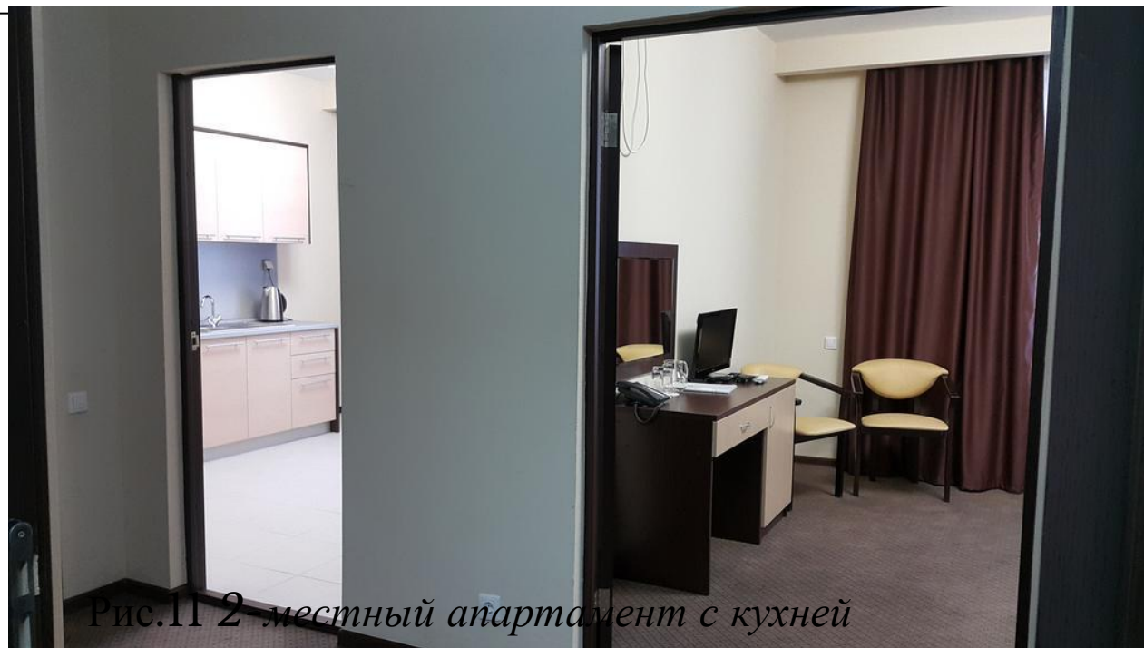
Рис.11 2-местный апартамент с кухней