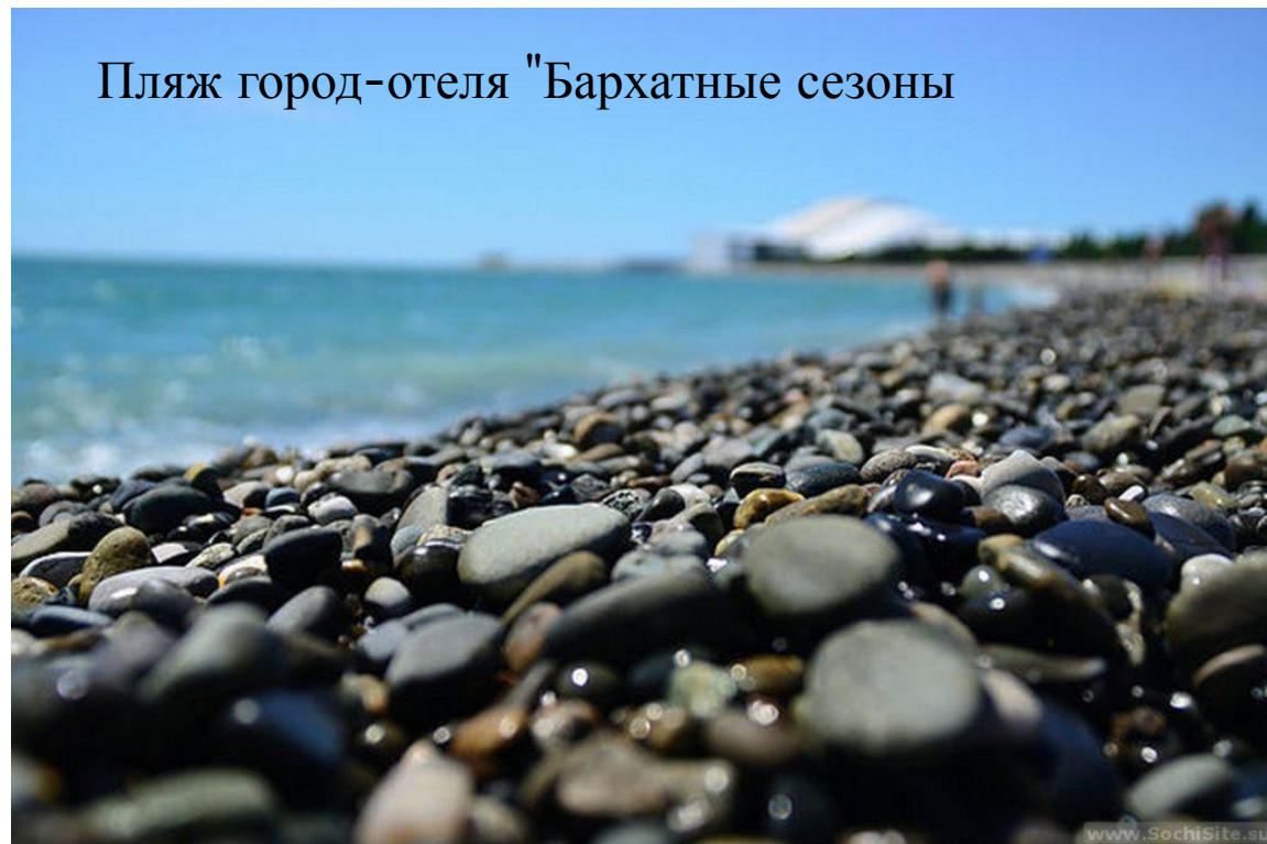
Пляж город-отеля "Бархатные сезоны"

В городе-отеле «Бархатные сезоны» два собственных оборудованных галечных пляжа. «Екатерининский» пляж - самый южный на Черноморском побережье. Ширина пляжей около 40 метров. Протяженность набережной - 6,5 км. На набережной работает прокат пляжного инвентаря, роликов и велосипедов. На каждом пляже выделена зона для купания детей. Также на территории пляжа установлены 2 детские надувные водные горки, детская комната, лабиринт, гидромассаж, душ Шарко, циркулярные кабинки