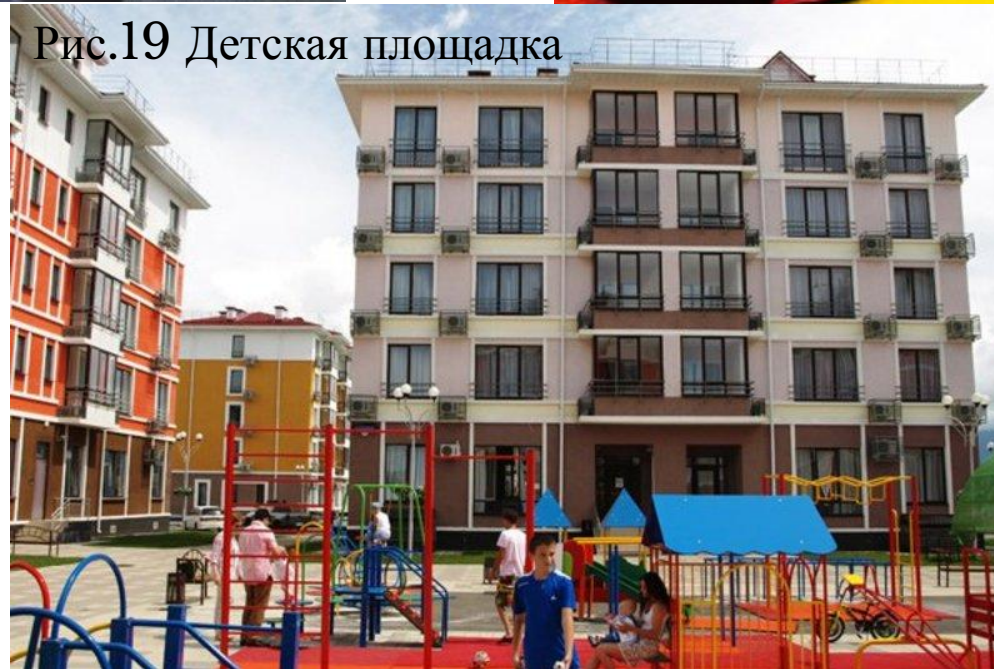
Рис.19 Детская площадка