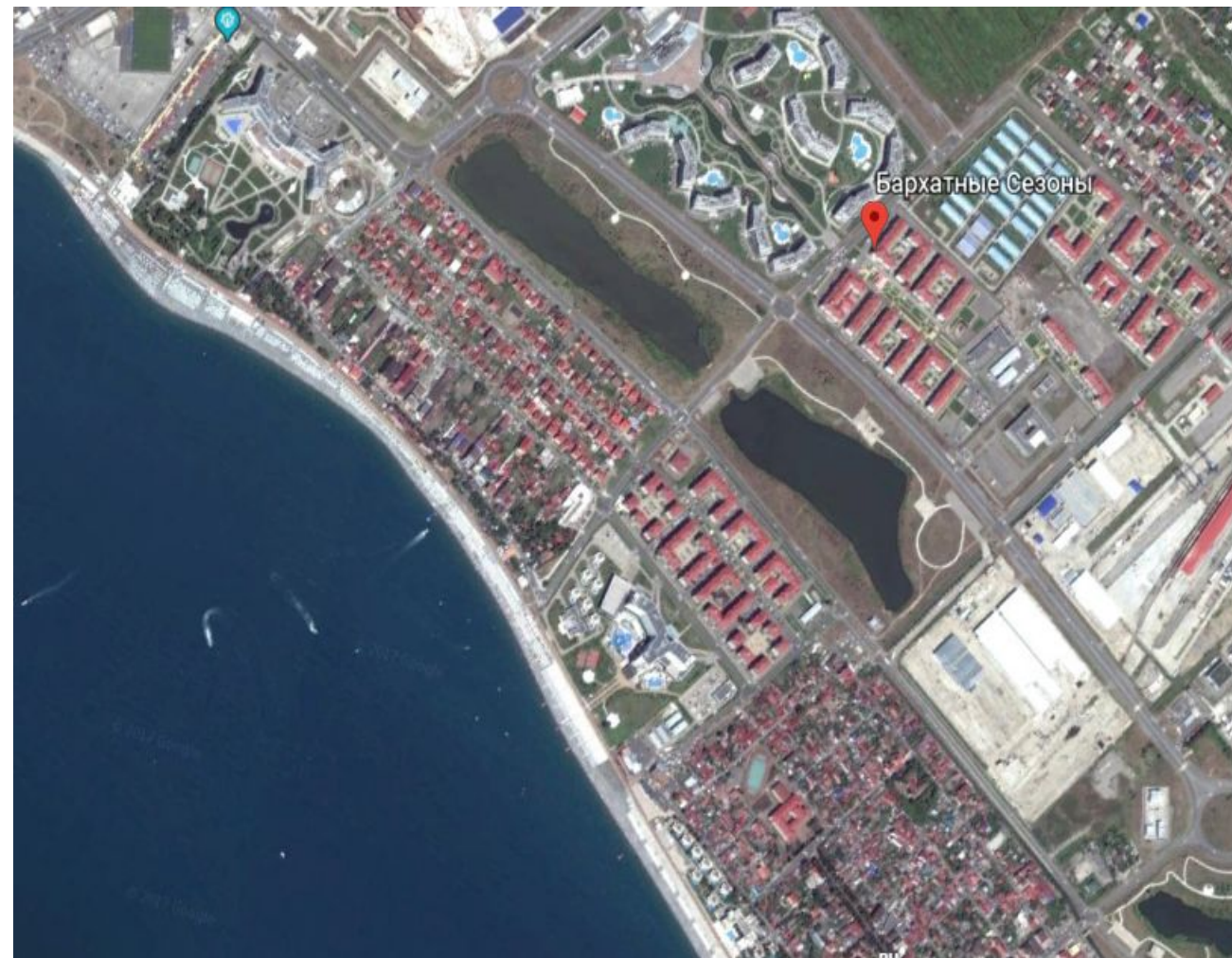
Рис.1 Снимок из космоса

В "бархатных сезонах" самый большой номерной фонд среди всех других гостиничных комплексов в Европе: одновременно в отеле могут разместиться до 17 500 человек. Благодаря собственным пляжам и близости к Олимпийскому парку, а также формату-города-отеля, "Бархатные сезоны" получили популярность у путешественников со всей России.