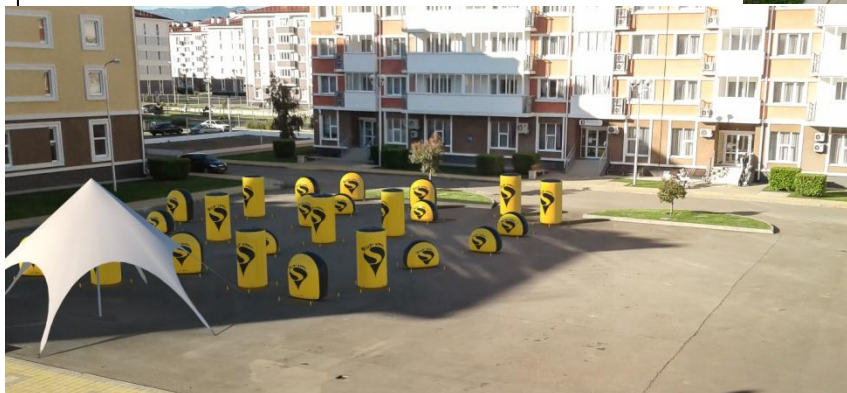
Рис.8 Площадка для лазерного боя