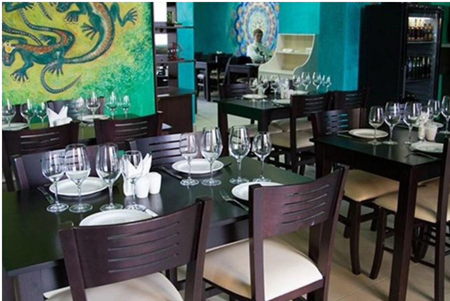
Рис.24 Ресторан "Чистые пруды"