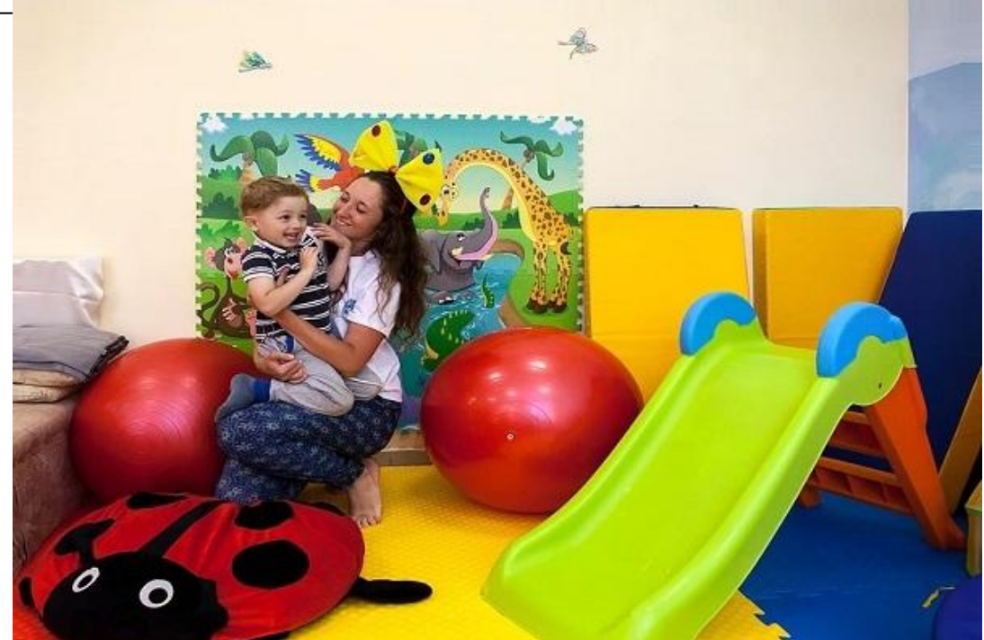
Рис.18 Детская комната