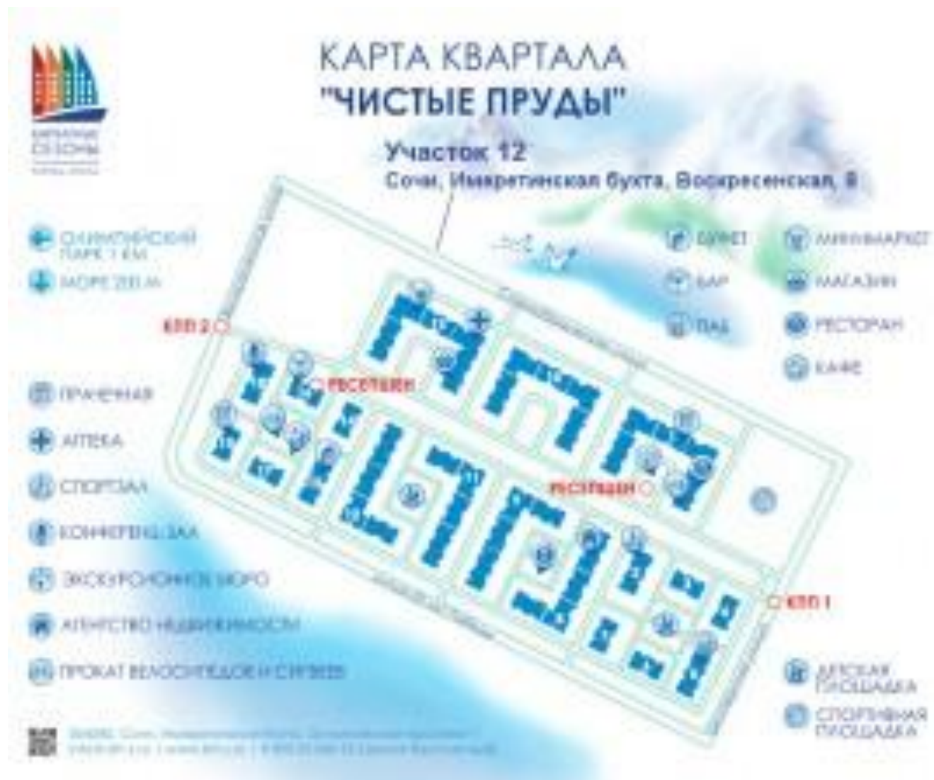
Рис.16 Инфраструктура "Чистые пруды"