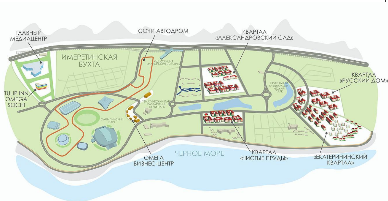
Рис.2 Карта город-отеля