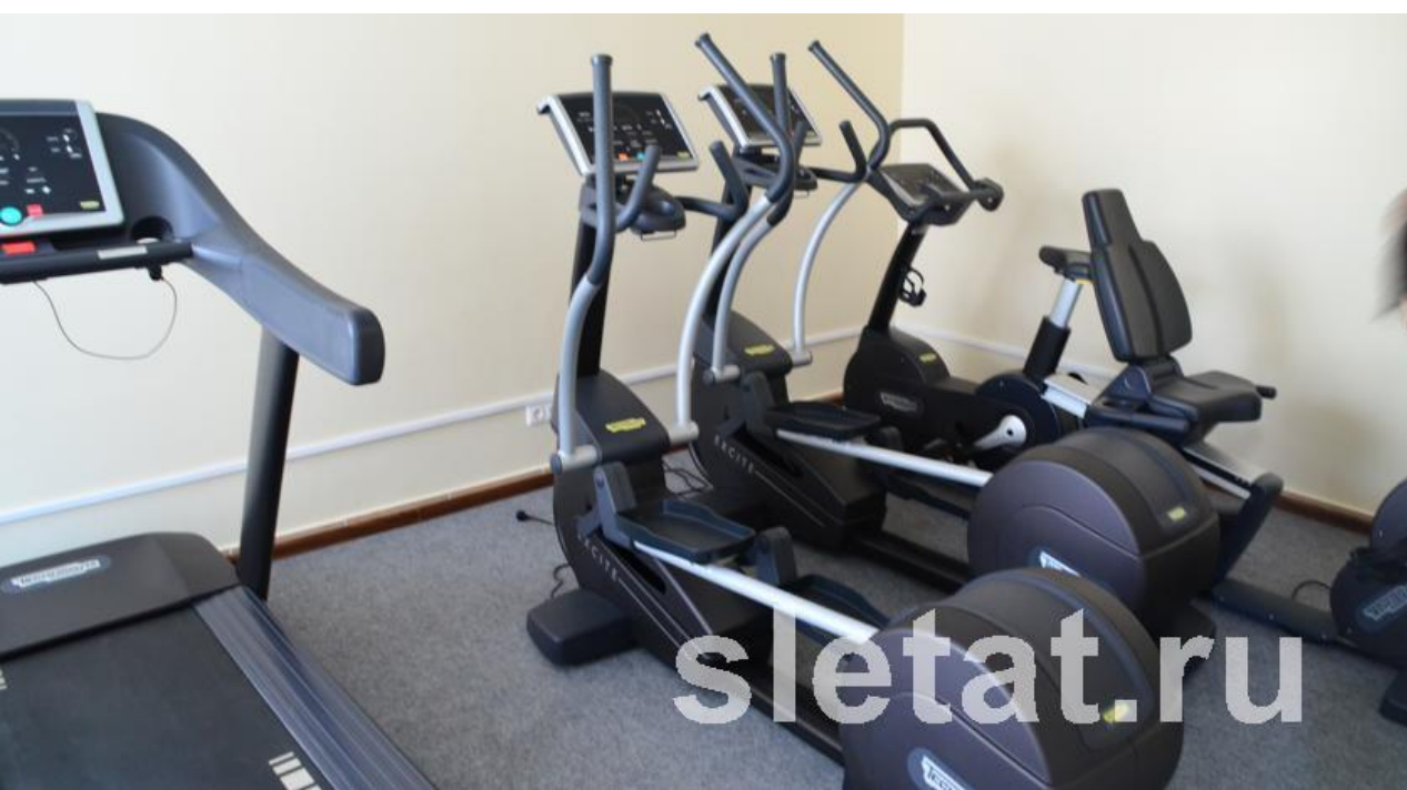
Рис.17 Тренажерный зал