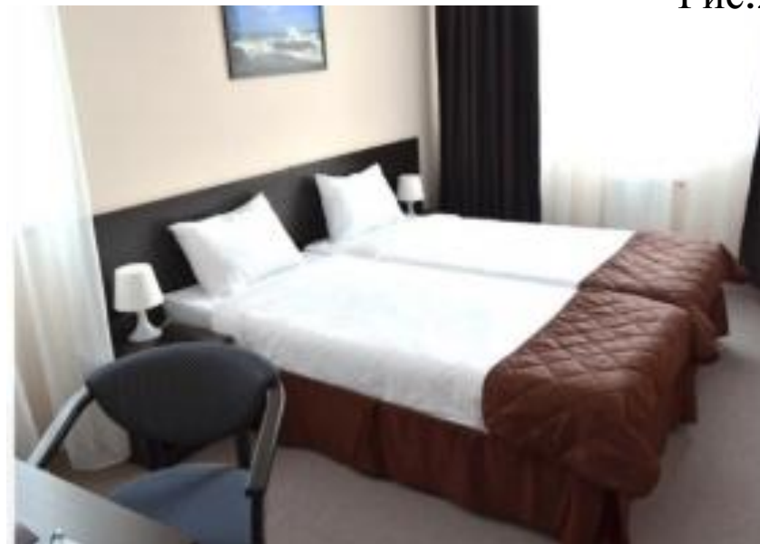
Рис.23 Стандартный 2местный