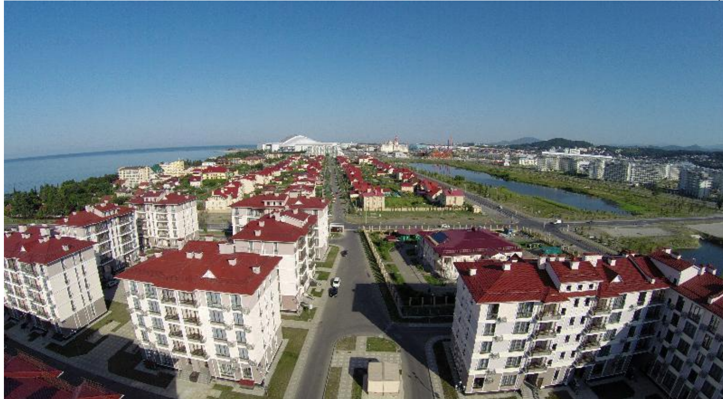
Рис.3 Екатеринбургский квартал