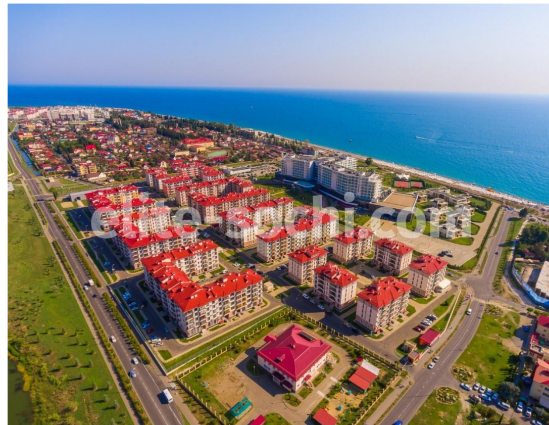
Рис.15 Комплекс "Чистые пруды"