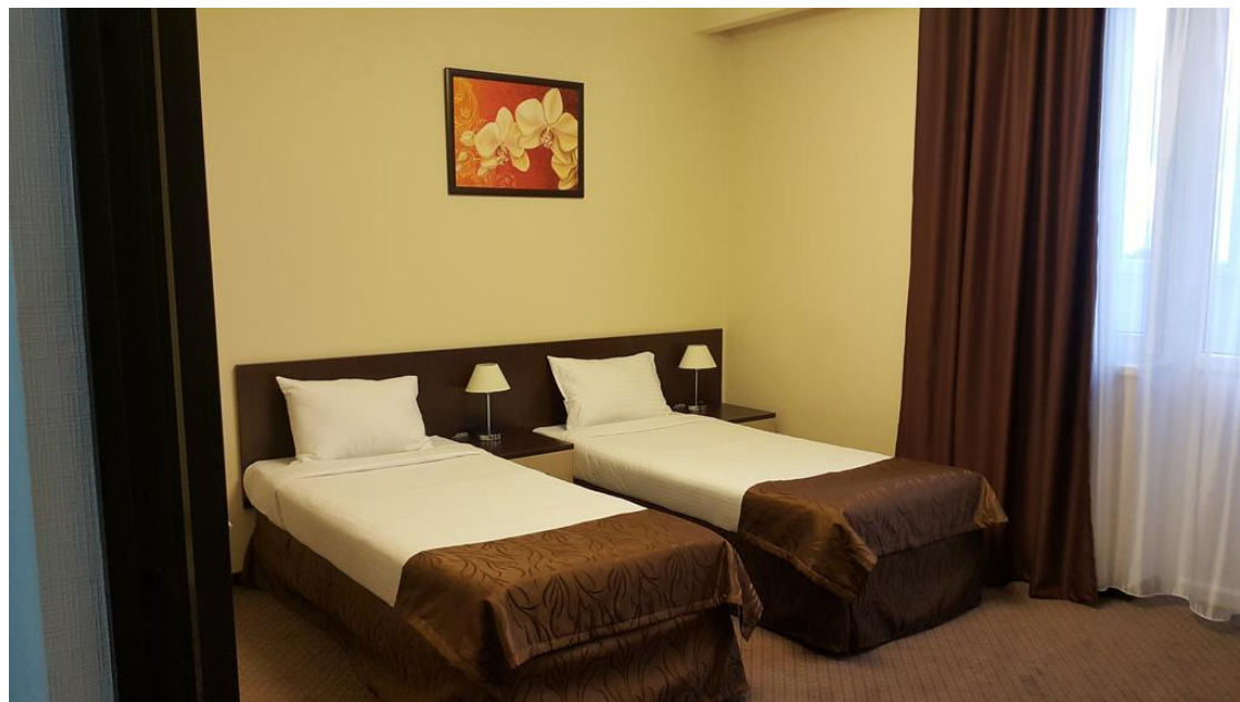
Рис.13 2-комнатные апартамент