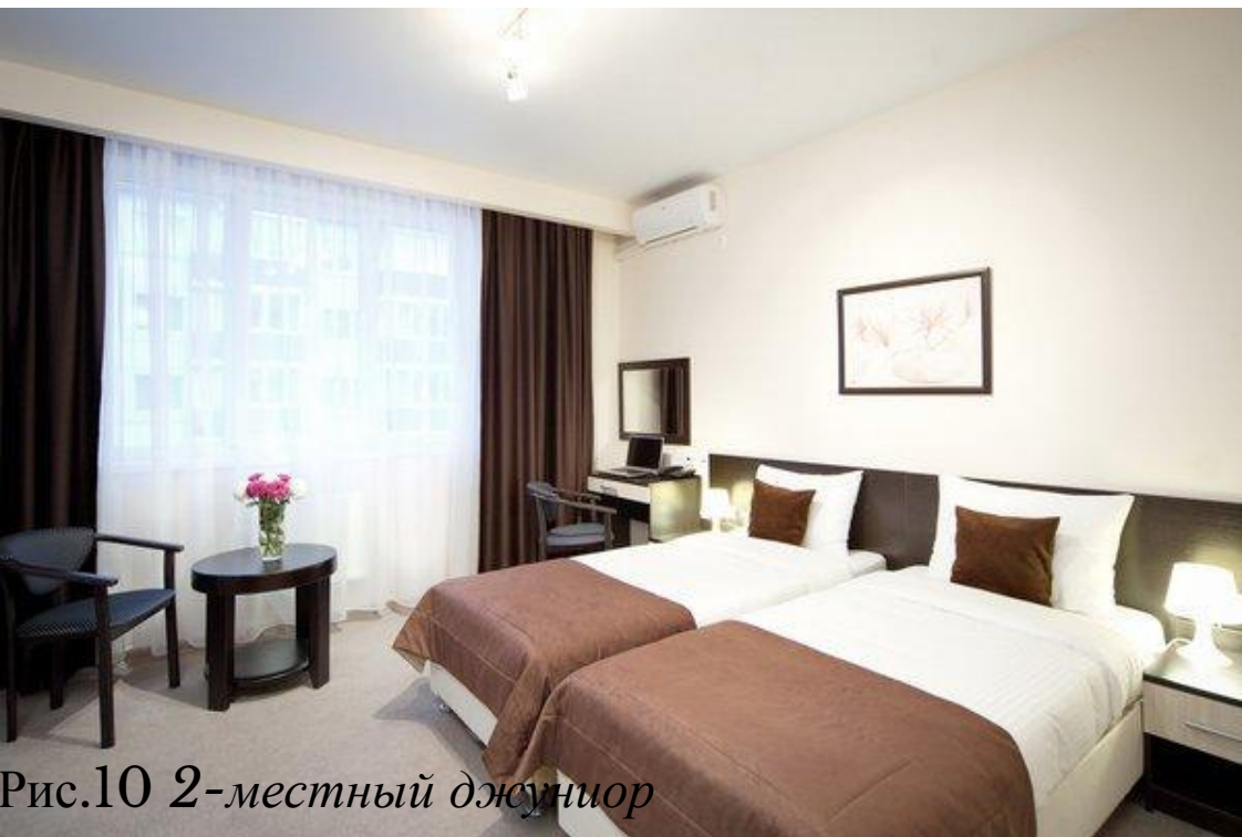
Рис.10 2-местный джуниор