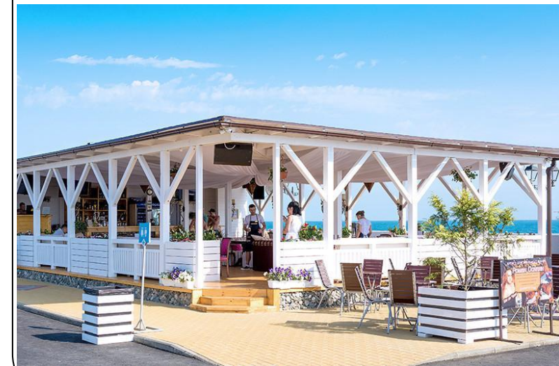
Бар на пляже