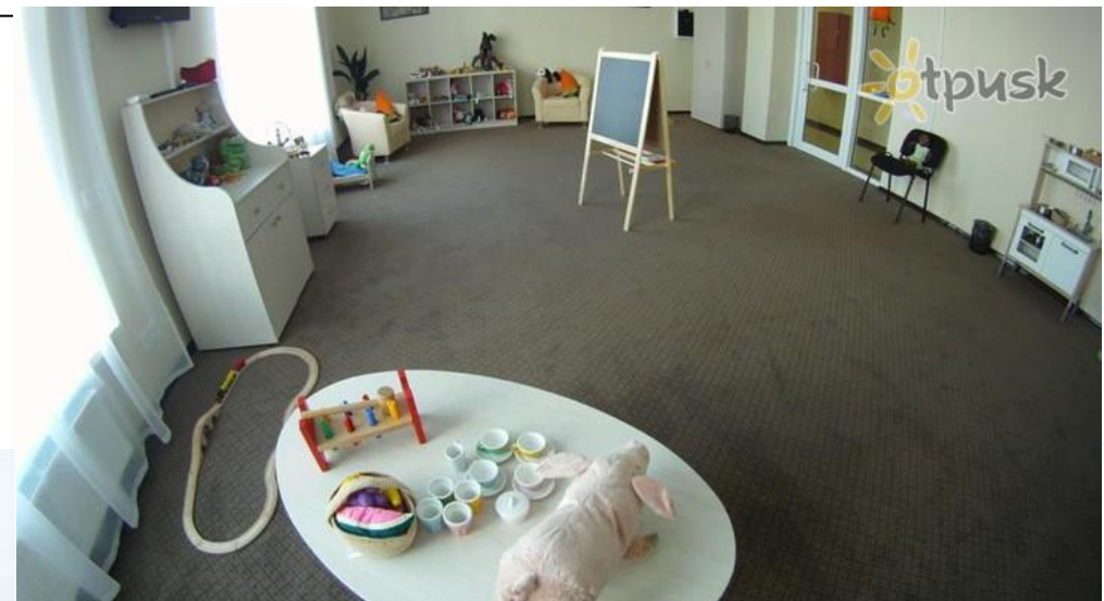
Рис.6 Детский клуб