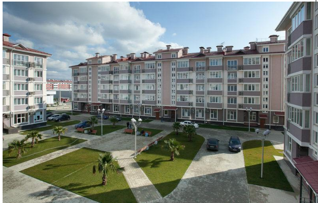
Рис.25 Комплекс "Русский дом"