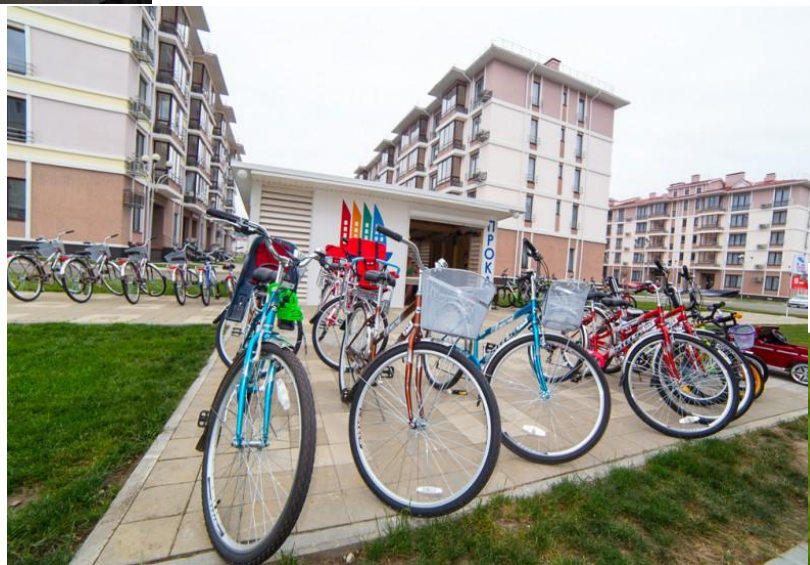
Рис.7 Прокат велосипедов