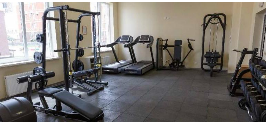
Рис.5 Тренажерный зал