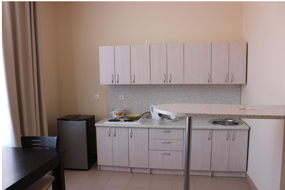
Рис.22 Апартаменты 2местный с кухней