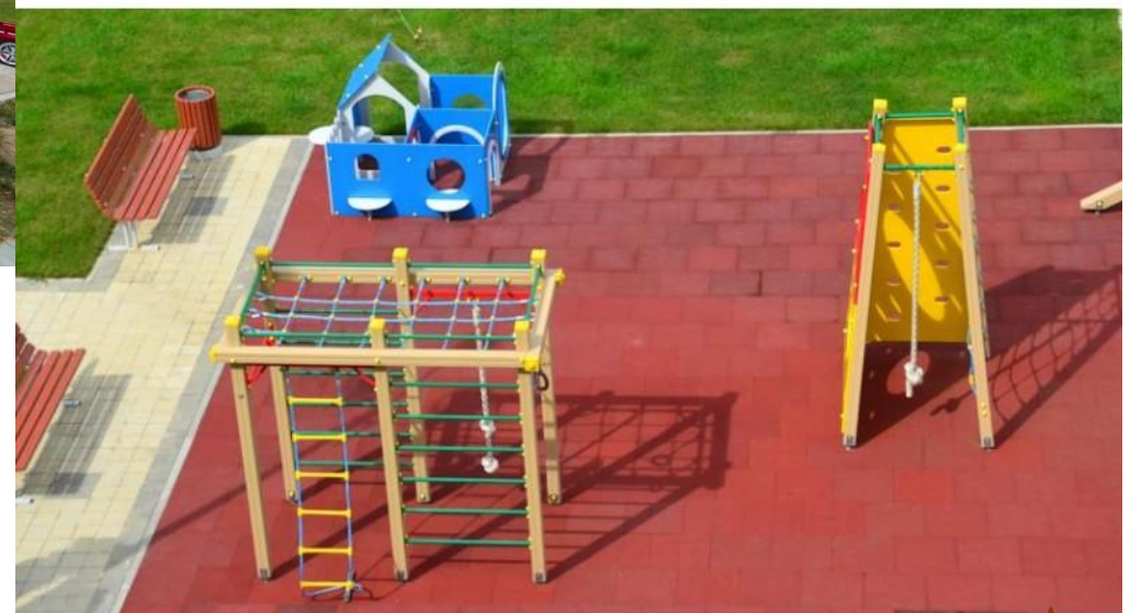
Рис.9 Игровая площадка