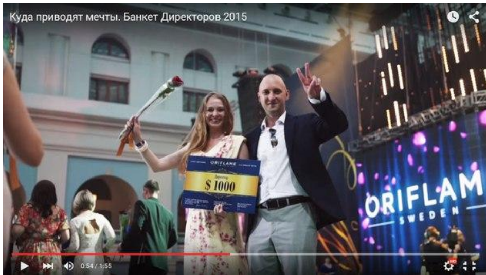
Куда приводят мечты. Банкет Директоров 2015