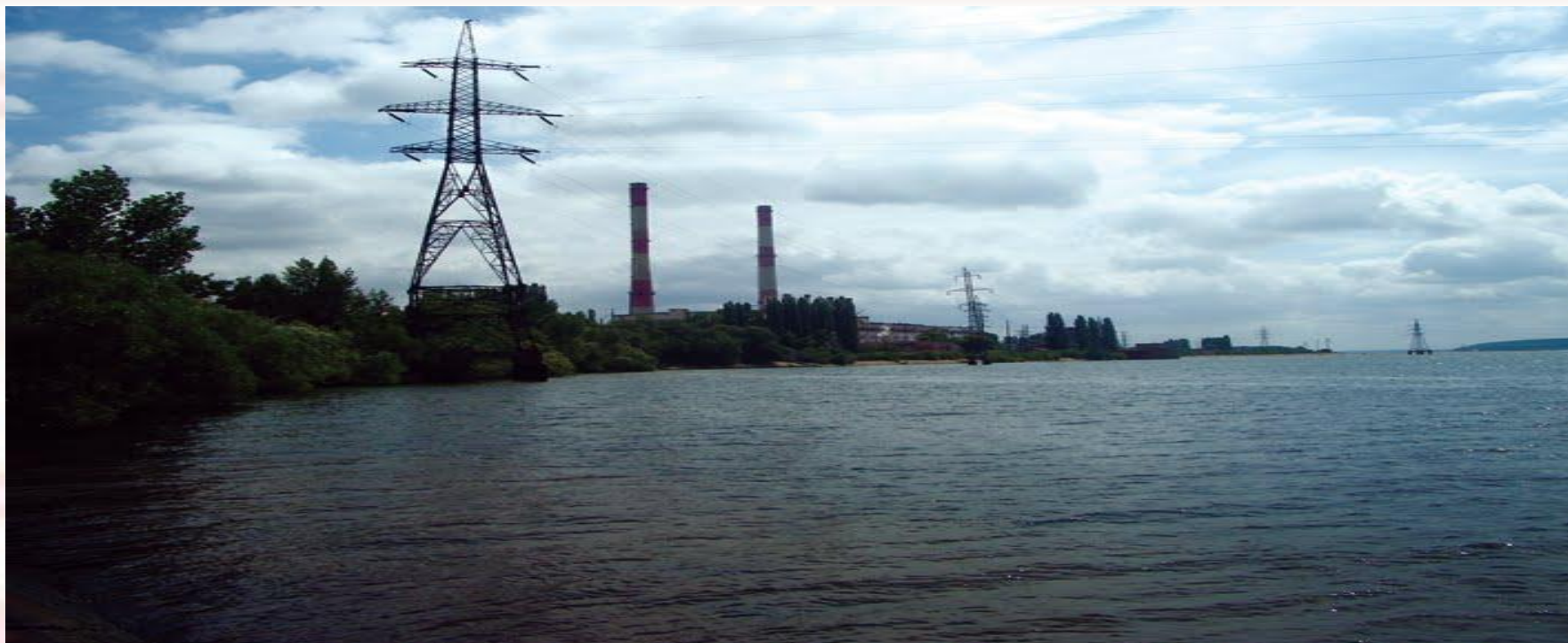
Воронежская ТЭЦ-1 (ВОГРЭС)

В Воронежской области находится 2 крупных электростанции. Воронежская ТЭЦ-1 (теплоэлектроцентраль, бывшая ВОГРЭС). Нововоронежская атомная электростанция (г. Нововоронеж), которая на 85% обеспечивает электроэнергией Воронежскую область.