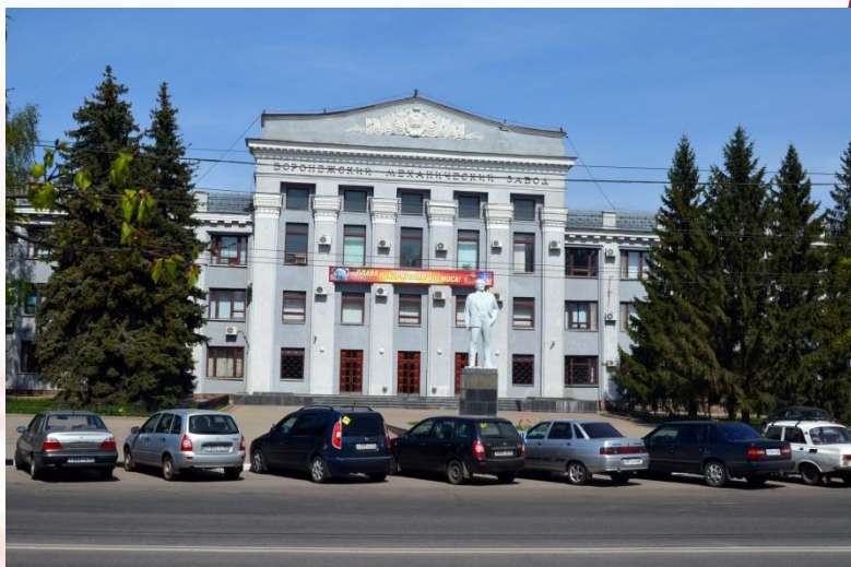
Воронежский механический завод

В Воронеже производят машины для сельского хозяйства, насосы, станки, прессы, бурильные установки, оборудование для нефтегазовой промышленности, кондиционеры, электродвигатели, электронные микросхемы, радиоаппаратура и другие изделия. Крупнейшие предприятия: механический завод, авиазавод, концерн «Созвездие», завод полупроводниковых приборов и другие.