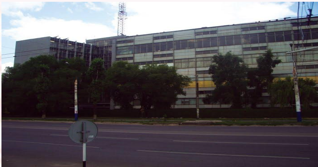
Воронежский завод полупроводниковых приборов – машиностроительное предприятие

Машиностроение – это отрасль промышленности, производящая машины и механизмы: станки, автомобили, тракторы, телевизоры, компьютеры и другую технику.