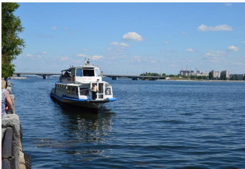
Прогулочный теплоход на

В пассажирских перевозках первое место занимает автомобильный транспорт (в основном из-за городских и пригородных автобусов), во много раз превышающий все остальные вместе взятые.