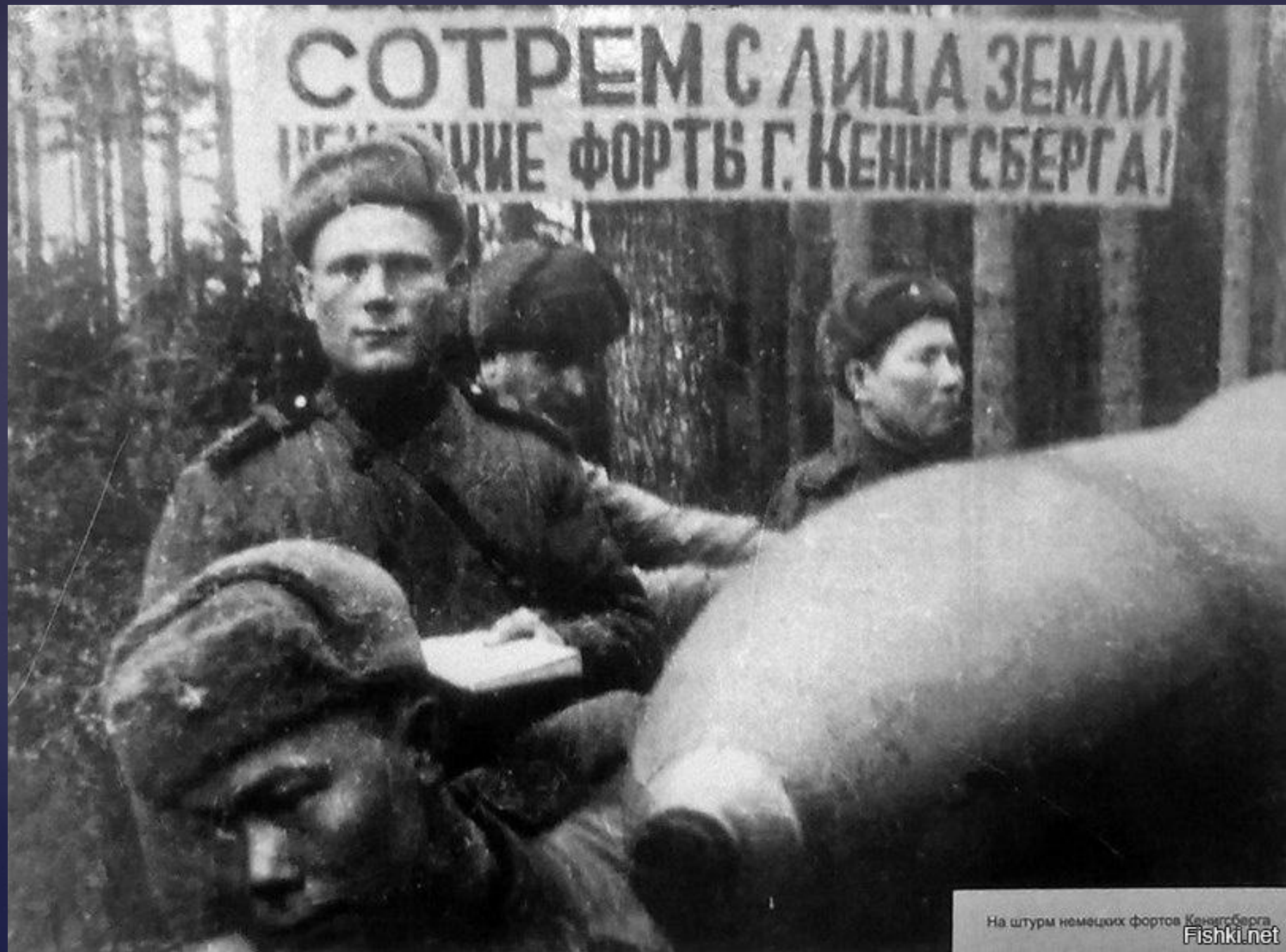
На штурм немецких фортов Кенигсберга

СОТРЕМ С ЛИЦА ЗЕМЛИ НЕМЦОВ И ИХ ФОРТЫ Г. КЕНИГСБЕРГА!