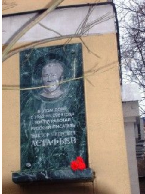
Мемориальная доска в Перми

В Перми установлена мемориальная доска памяти писателя Виктора Астафьева по адресу ул. Ленина, 84.