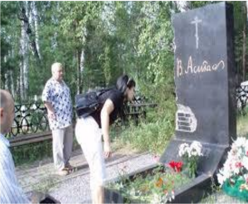
Скончался 29 ноября 2001 года в Красноярске. Похоронен в Овсянке.