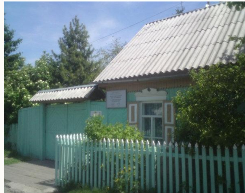
Мемориальный дом-музей В. П. Астафьева

Родился 1 мая 1924 года в селе Овсянка, что на берегу Енисея, недалеко от Красноярска.