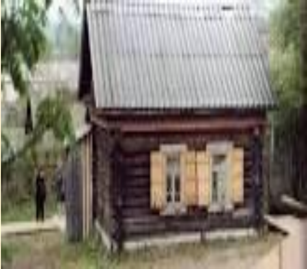
Домик Астафьевых в г. Чусовом.