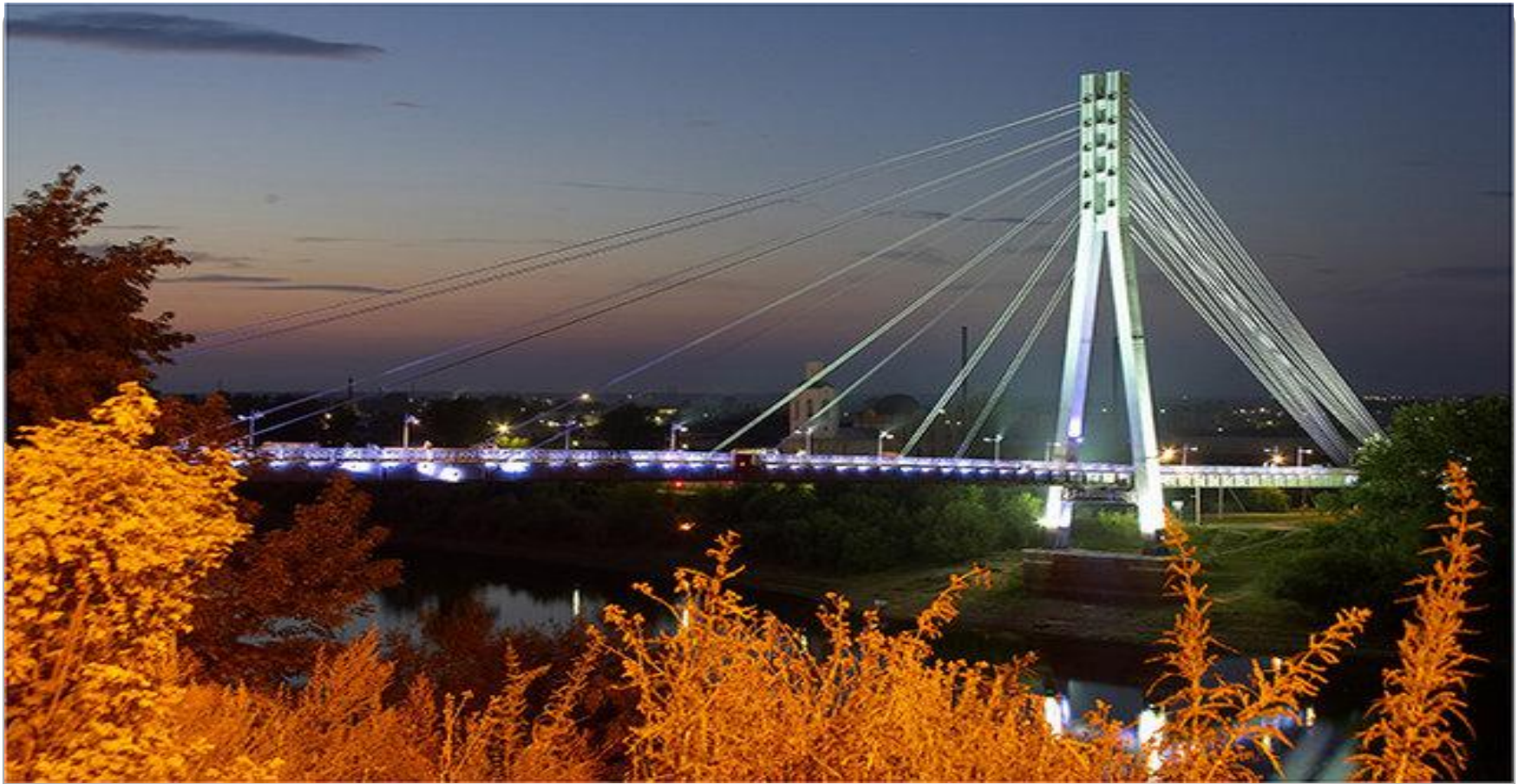
Пешеходный мост в Тюмени