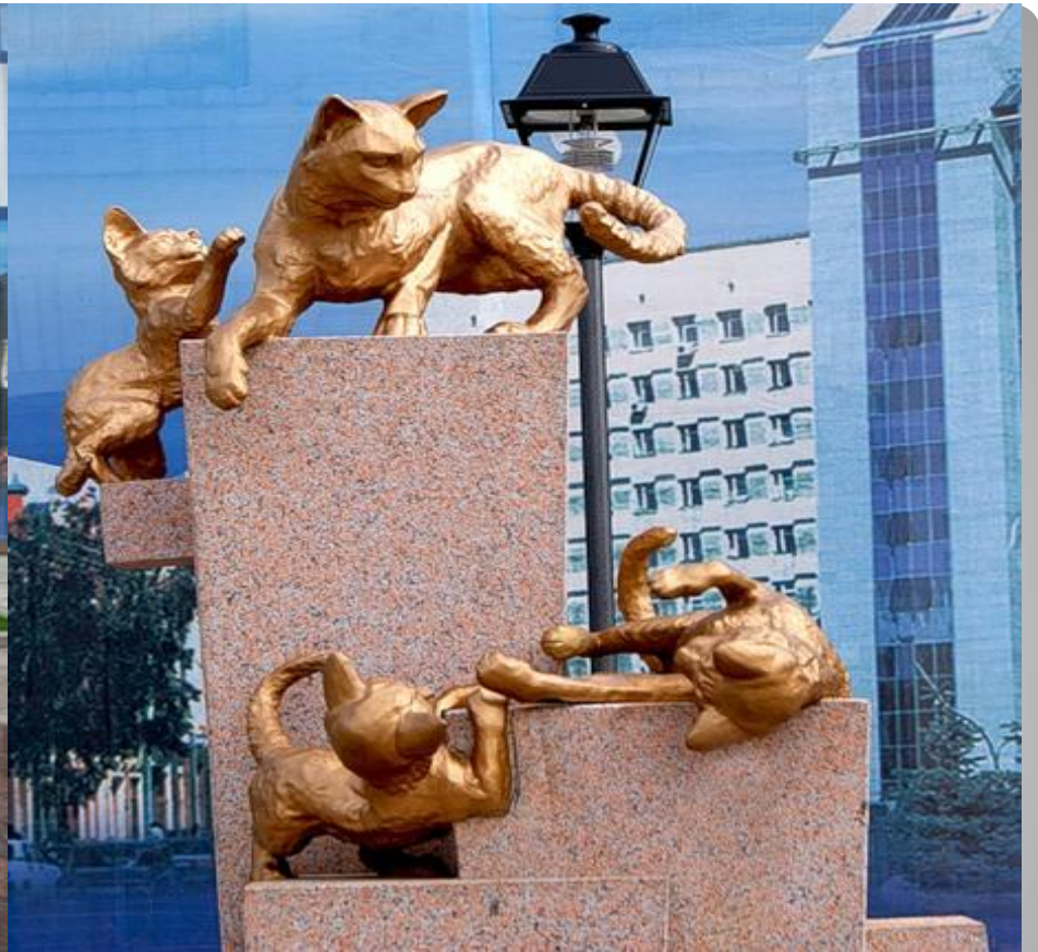
Памятники кошкам в Тюмени.