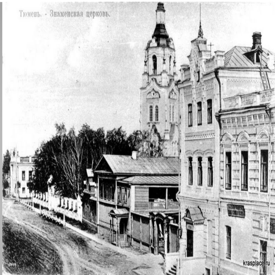
Тюмень. - Знаменская церковь.