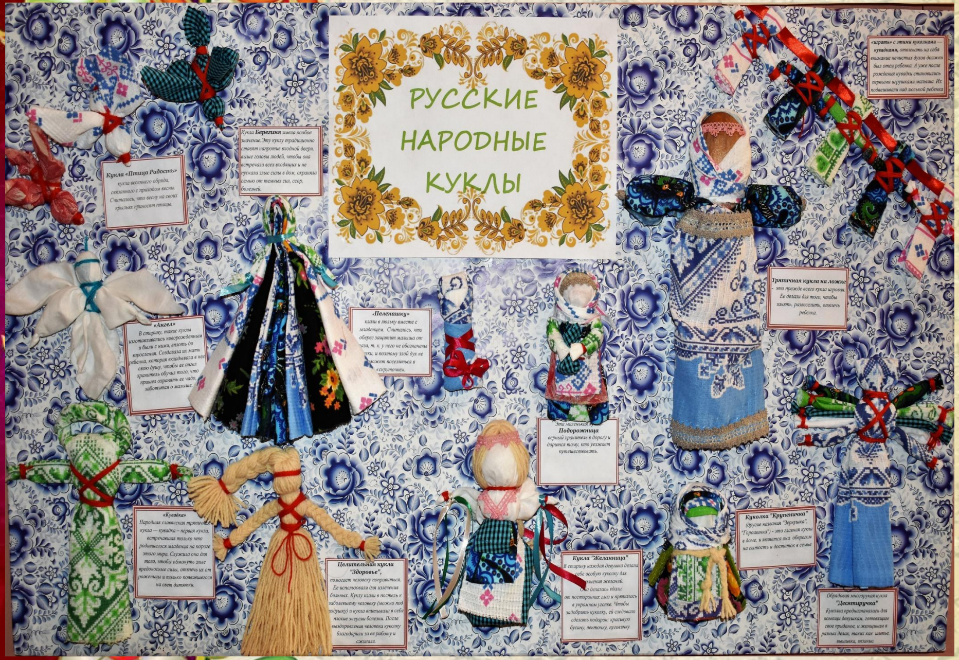
«Играет» с теми куклами — кувалками, отплатить на себя вышивкой, нечестно дура, должен был отец ребенка. А уже после рождения куклы становилась термометром ищущим малыши. Их подвешивали над люлькой ребенка.