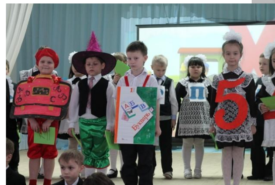
Прощание с букварём