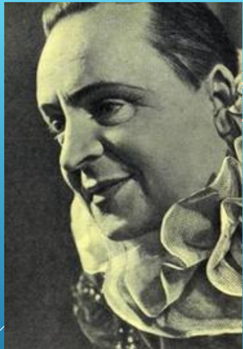
Российский дрессировщик и цирковой артист Владимир Леонидович (7 июля 1863 года - 3 августа 1934 года)